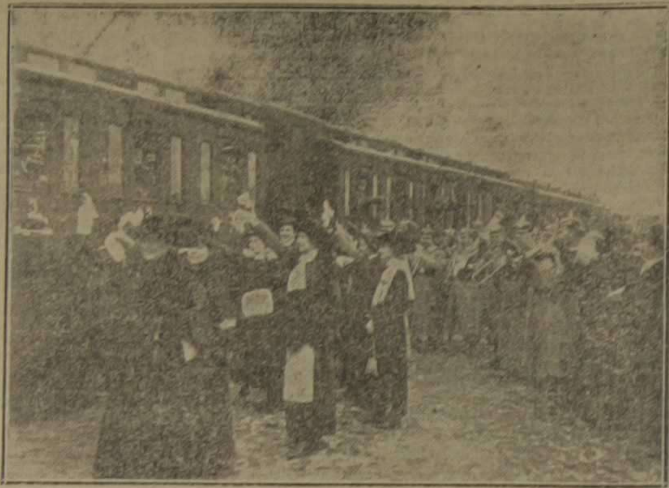
Despedida de reservistas alemanes que van a la línea del frente