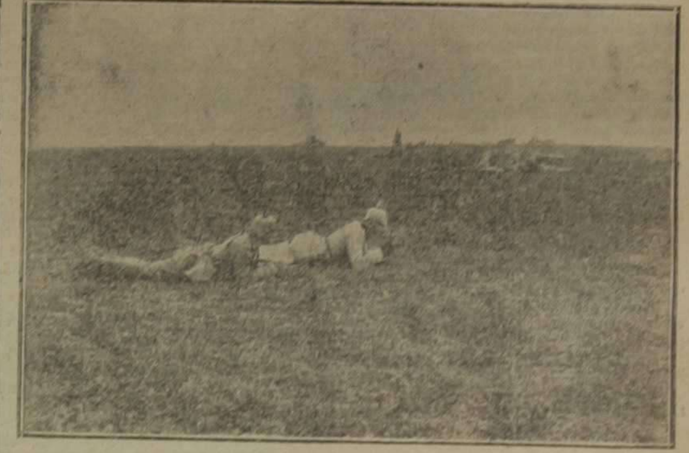
Tropas alemanas al servicio de ametralladoras, en posición de ataque a campo raso