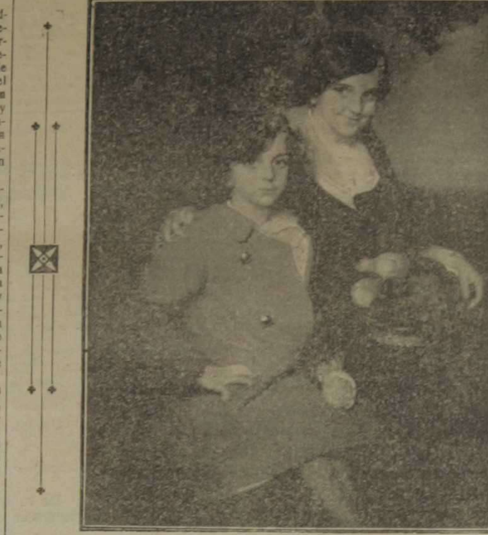
Mis sobrinas.—Cuadro que figura en la Exposición de es e año

Luchador infatigable, voluntad ardorosa, espíritu progresivo, inaugura su vida de arte en las clases de la Real Academia de San Carlos para temer las armas que utilizará en los combates de mañana, duros y penosos. Crece que fué en 1888 cuando, por primera vez, aún niño, se matriculó en las clases de Figura y Paisaje elemental, entonces dirigidas, la primera, por don Gonzalo Salvá, el maestro de legiones de artistas valencianos, y la segunda, por el di-