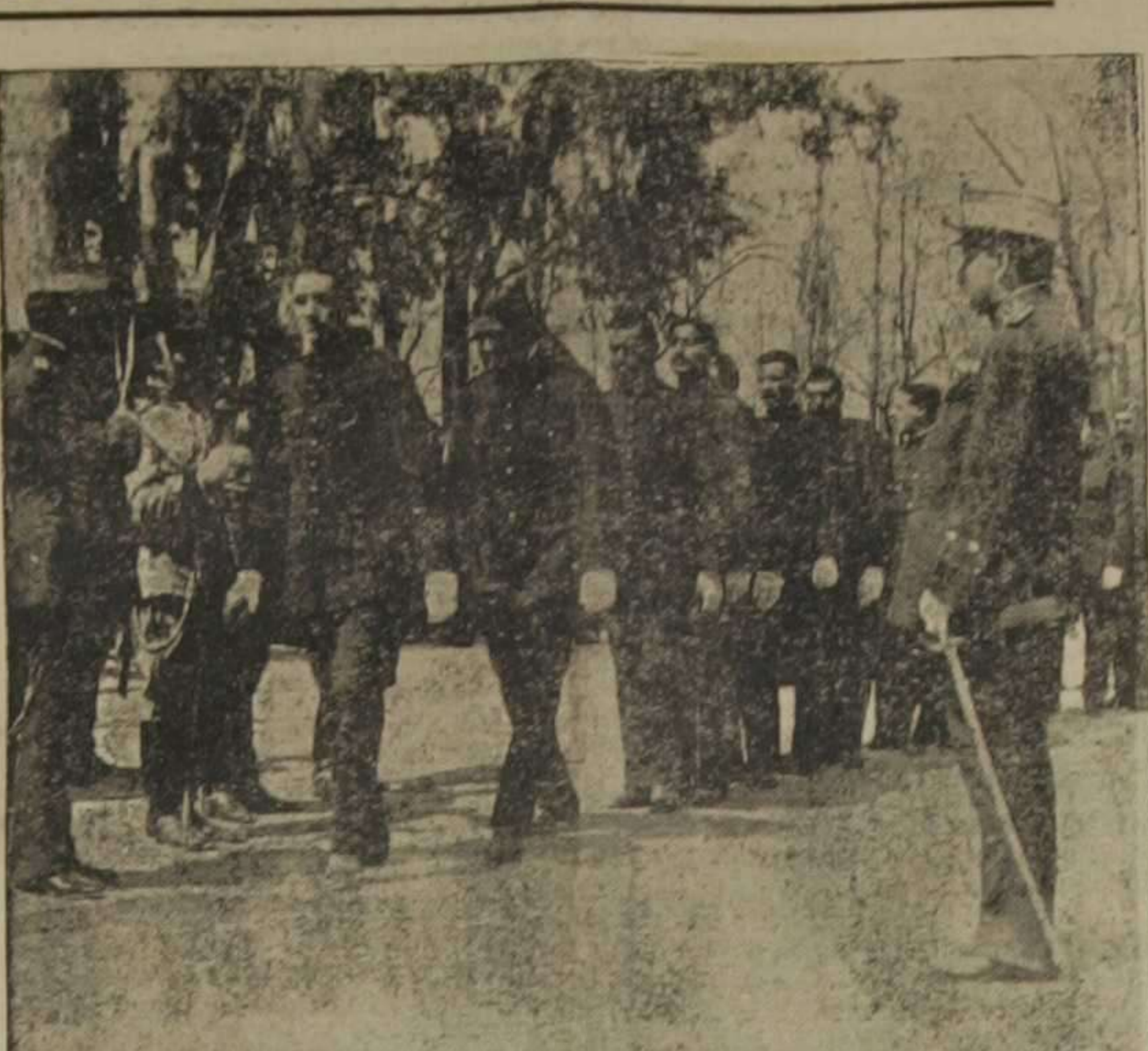
Los reclutas de Sanidad Militar en el momento de besar la cruz, formada por el estandarte de caballería de Victoria Eugenia y el sable del jefe de dicha fuerza.