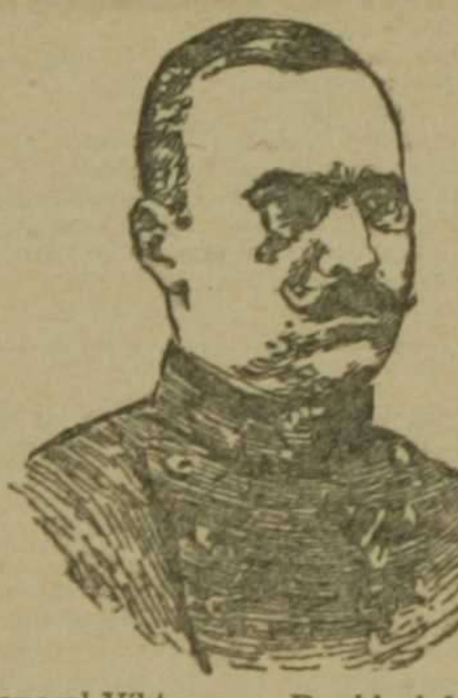
General Viktor von Dankl, jefe del Estado Mayor del general Hindenburg