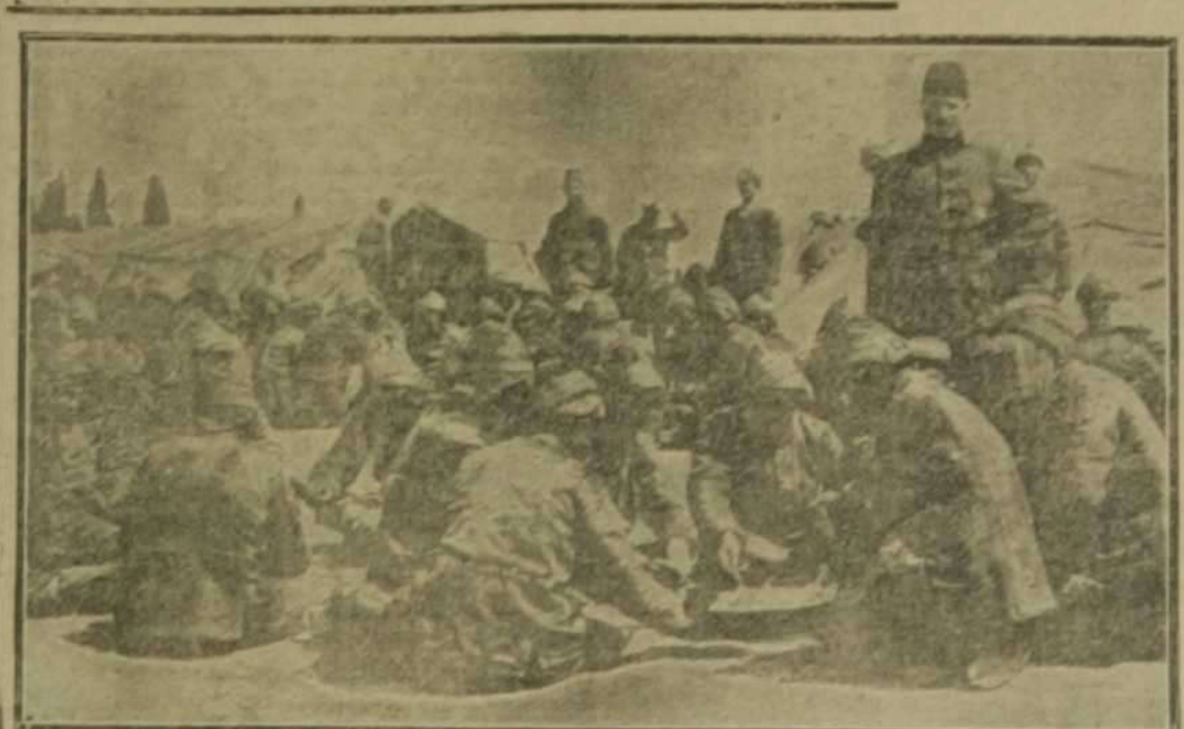
Tropas turcas en la frontera del Cáucaso