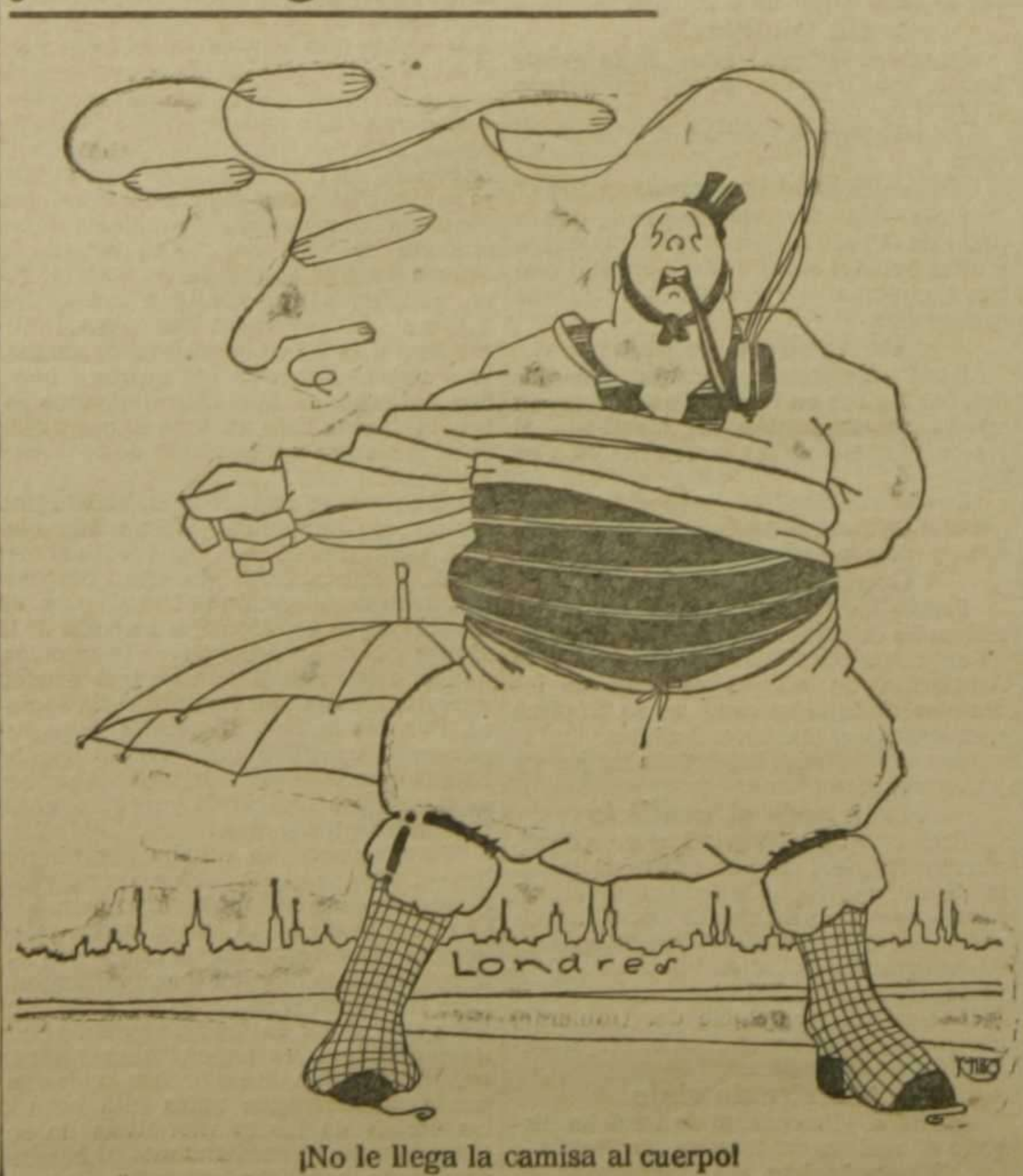
¡No le llega la camisa al cuerpo!

militares y se ejercerá una estrechísima vigilancia sobre los buques mercantes. Aunque nada se dice oficialmente, los propósitos del Gabinete británico de relevar al virrey de la India, dan a entender que la sublevación de los indígenas es de gran importancia. Todos estos hechos indican con indiscutible claridad que la situación de los aliados va siendo cada vez menos satisfactoria, y que el término de esta tremenda conflagración se ve cada día más lejano. SANCHO.