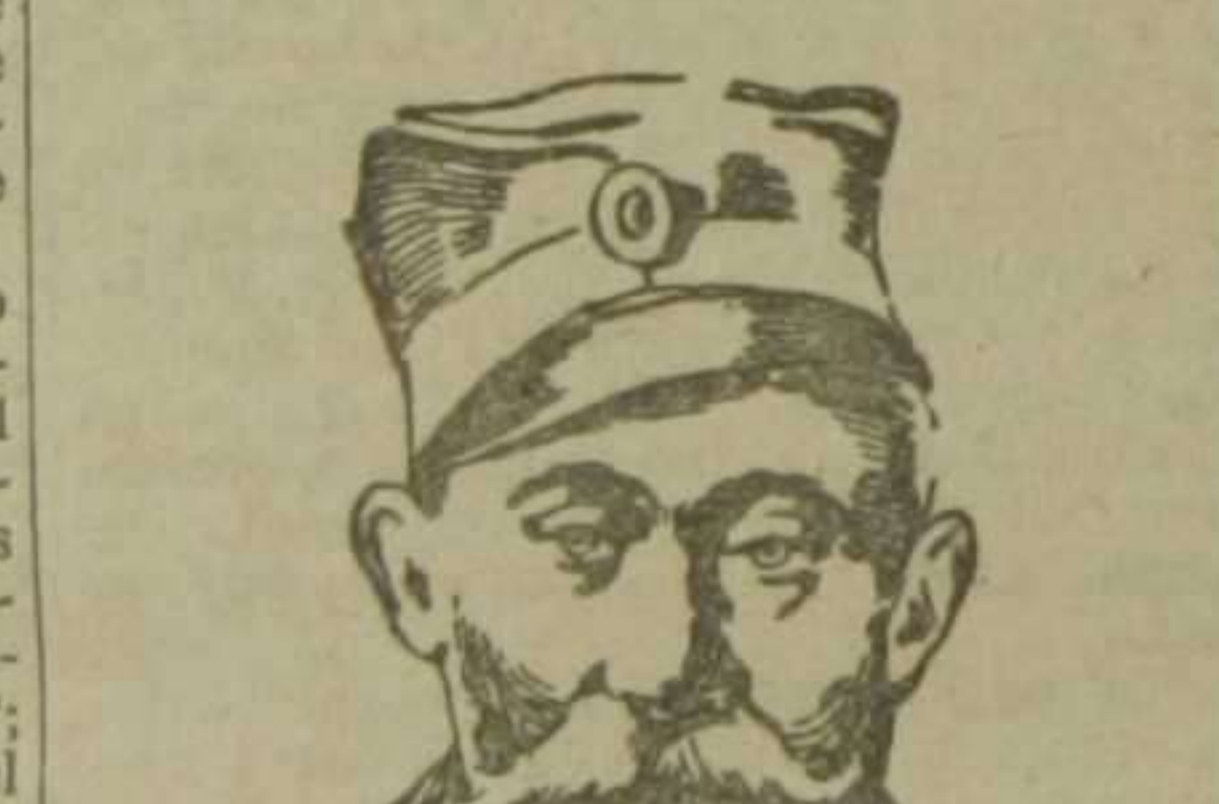
General Stefanovich, ministro de la Guerra de Servia y comandante en jefe del ejército del Danubio

(Original alemán del poeta Theodor Koerner. Música de F. H. Himmel.)