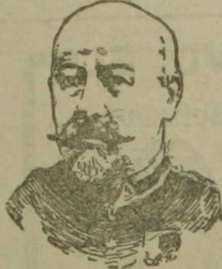
General Sonkomiñoff, ministro de la Guerra de Rusia

En tercera y cuarta página, Aurelia o los judíos de la Puerta Capena