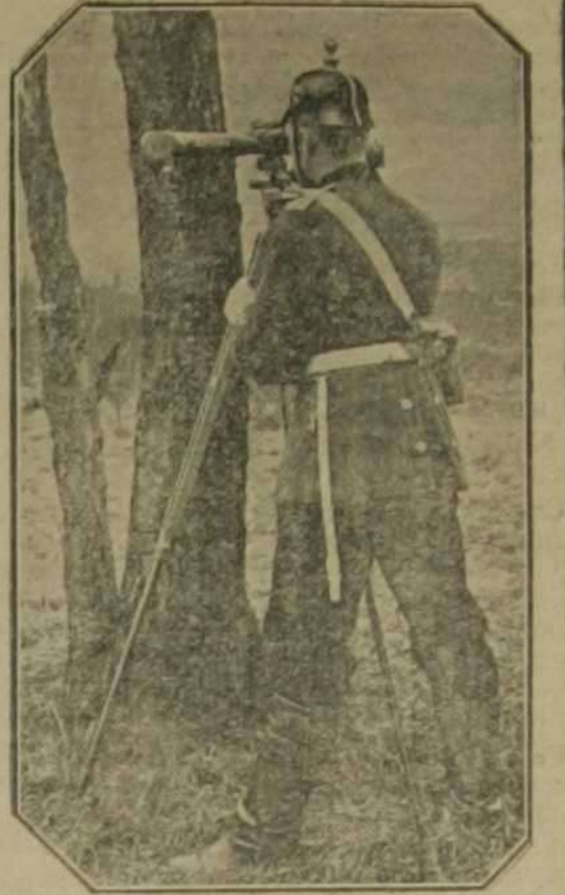
Oficial alemán haciendo observaciones con unos gemelos articulados, cubierto por un árbol

de hijos y de recursos. Su dominadora era la nación más poderosa de la tierra. Siglos de guerra habían abierto entre los dos pueblos abismos insondables. La previsión humana había fallado sobre el término de la secular contienda. Y como juzgaba con la mirada puesta en el poder de la fuerza material, despreciando la fuerza de la justicia y la fuerza de la abnegación de un pueblo decidido a ir hasta el fin por el camino del Calvario, se equivocó una vez más el cálculo humano. Olvidaba el poder angusto del patriotismo, vivificado por el espíritu de inmolección y olvidaba que tras las sangrientas crestas del Calvario brillan para los que padecieron por la justicia las alturas del Olivete glorioso.