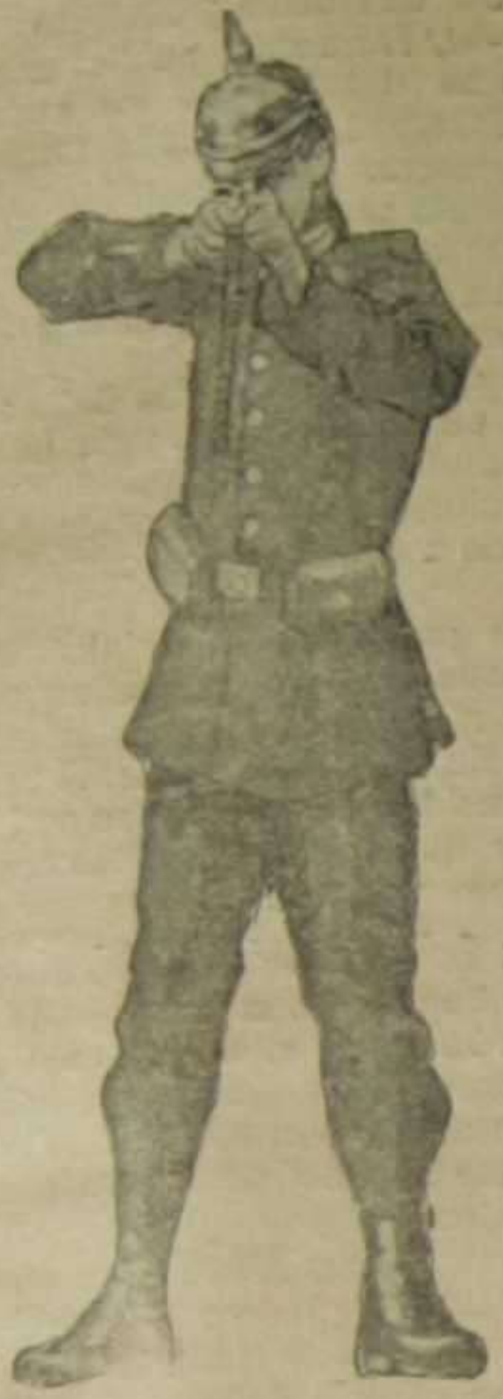
Soldado alemán haciendo puntería

Sigue con gran encarnizamiento la batalla en el Aisne Los alemanes estrechan los sitios de Amberes y Verdun