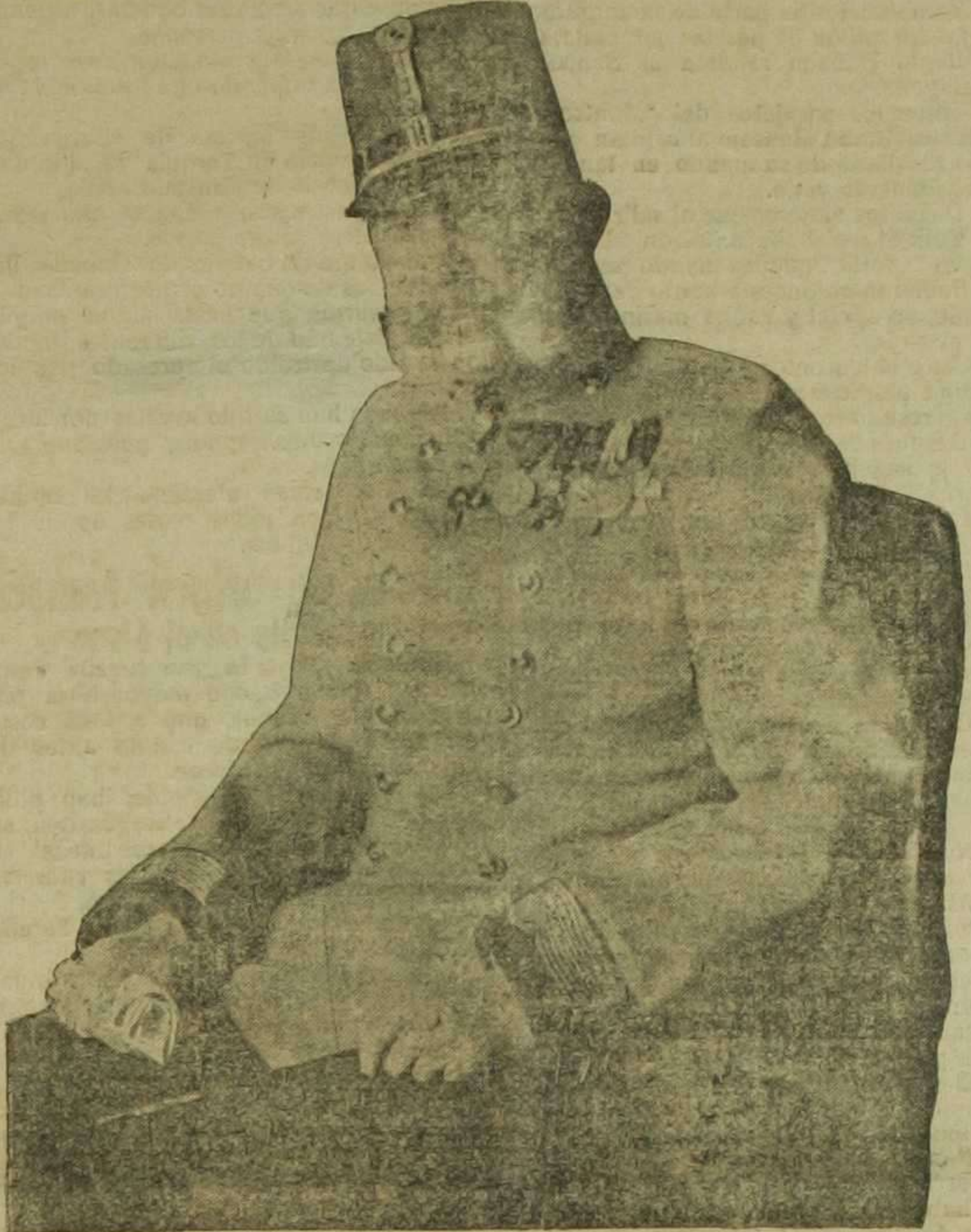
El anciano emperador de Austria, rey de Hungría, Francisco José

Quinta. Que los rusos están hoy ante Przemysl y, por tanto, a trescientos kiló-