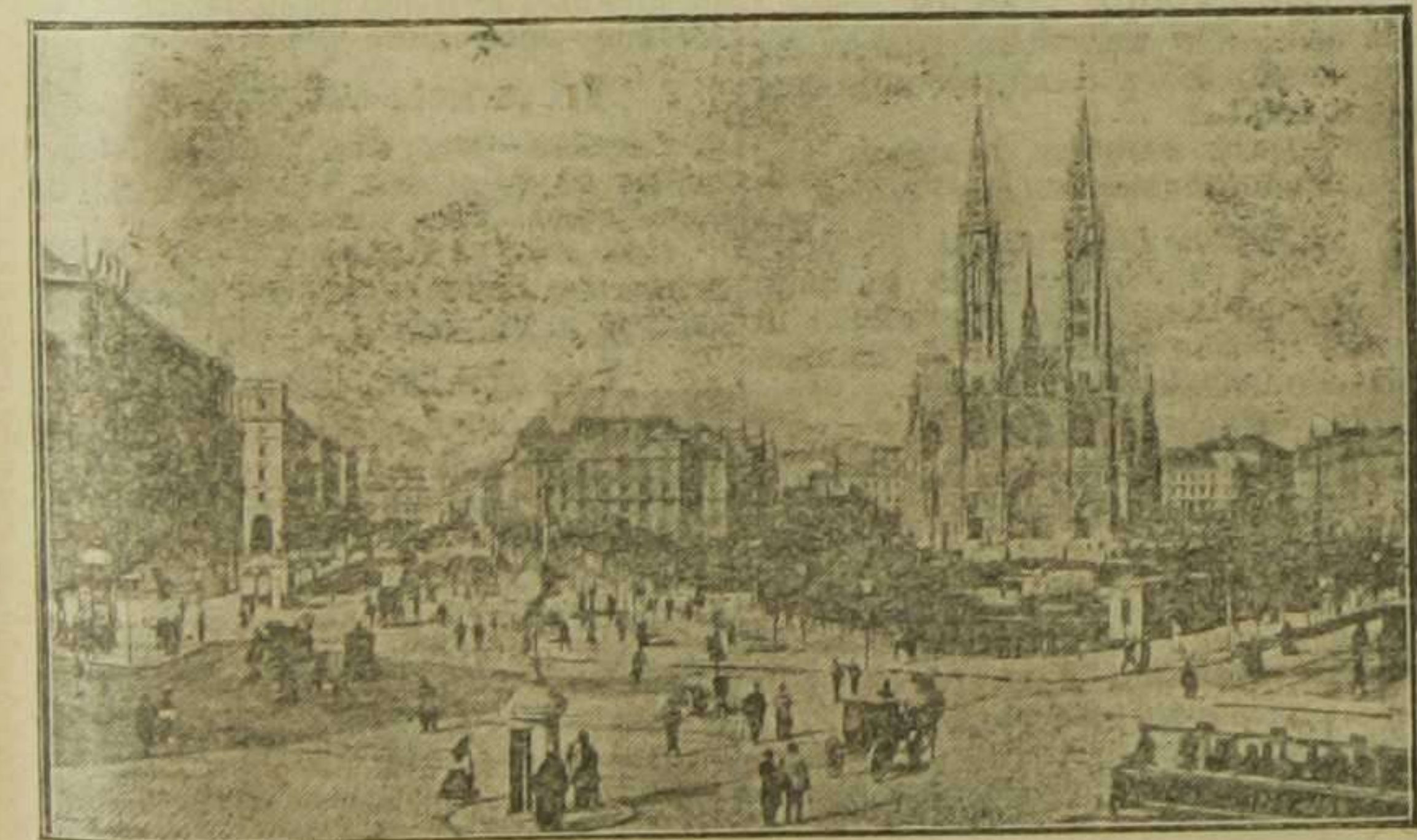
Viena.—Plaza de Maximiliano