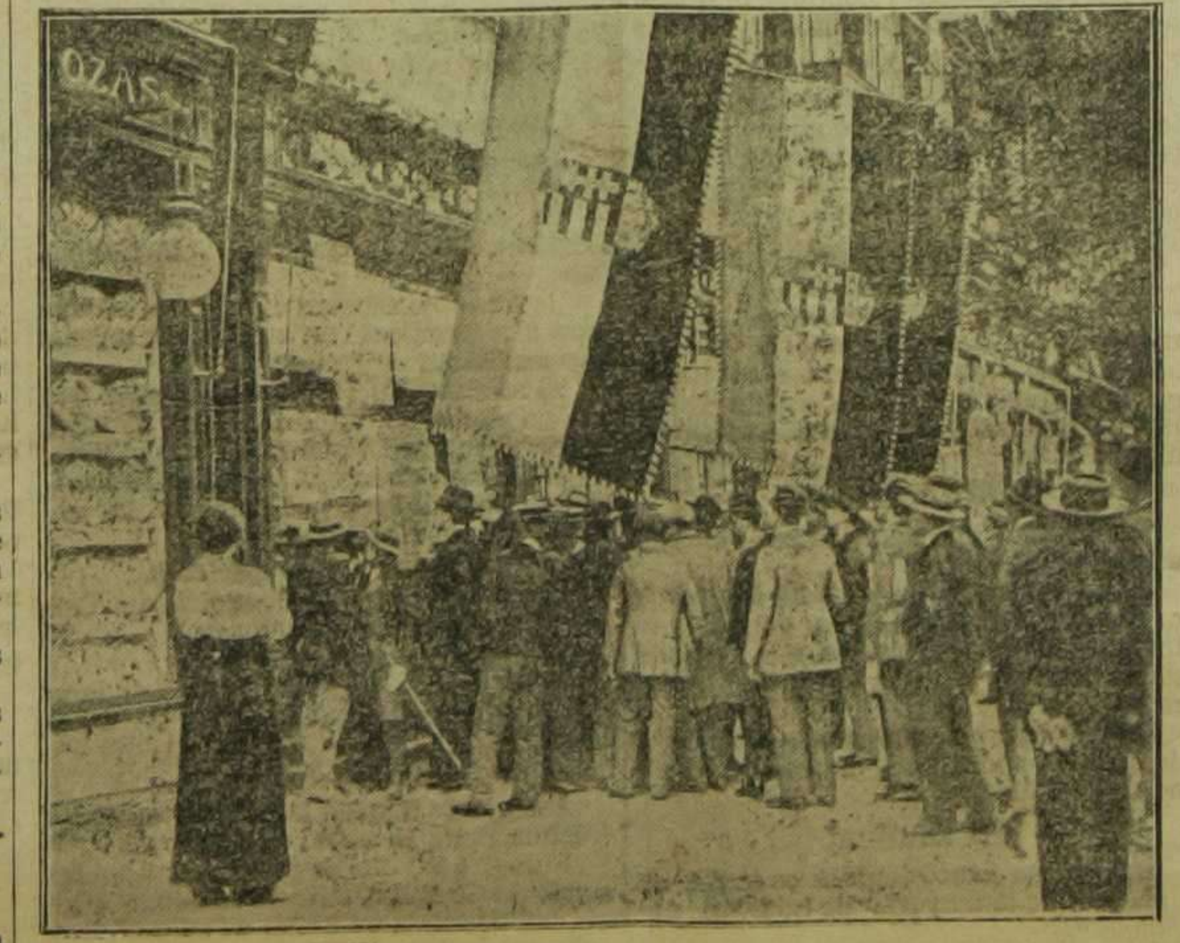
Budapest.—El público leyendo noticias de la guerra ante los transparentes de un periódico