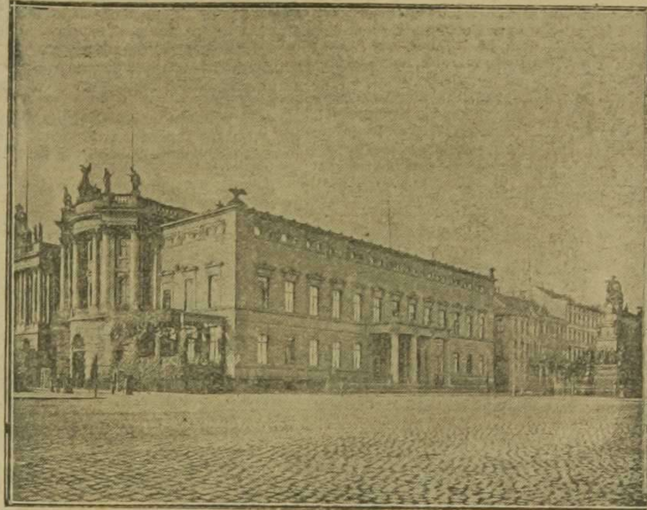
2. El palacio real en la preciosa Avenida de los Tilos (Unter den Linden), de Berlín, donde vive el emperador de Alemania