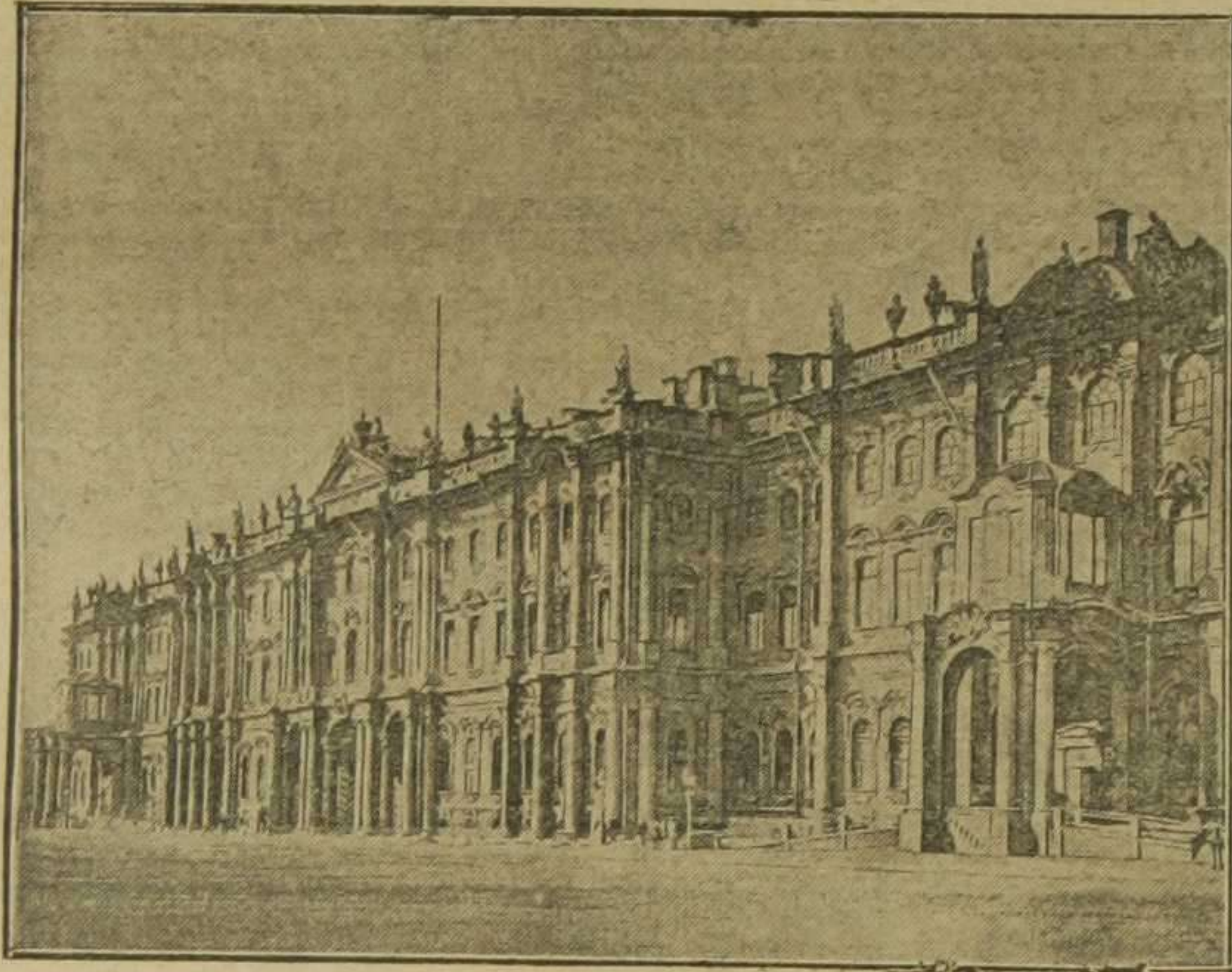
1. El palacio de Invierno, en San Petersburgo, residencia habitual del zar de Rusia