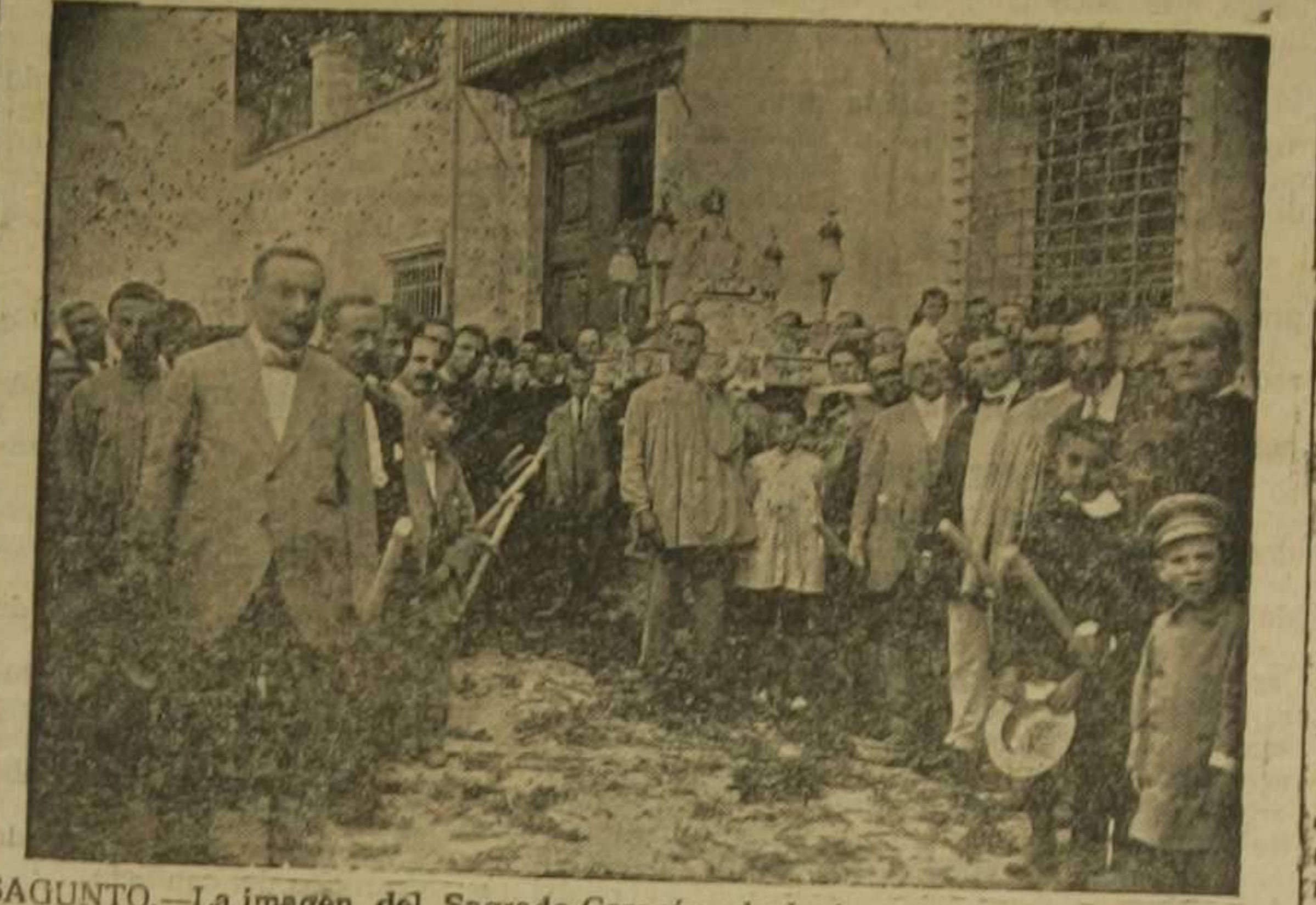
SAGUNTO.—La imagen del Sagrado Corazón de Jesús a su paso por el Circulo Legitimista. Véase la reseña en tercera página.