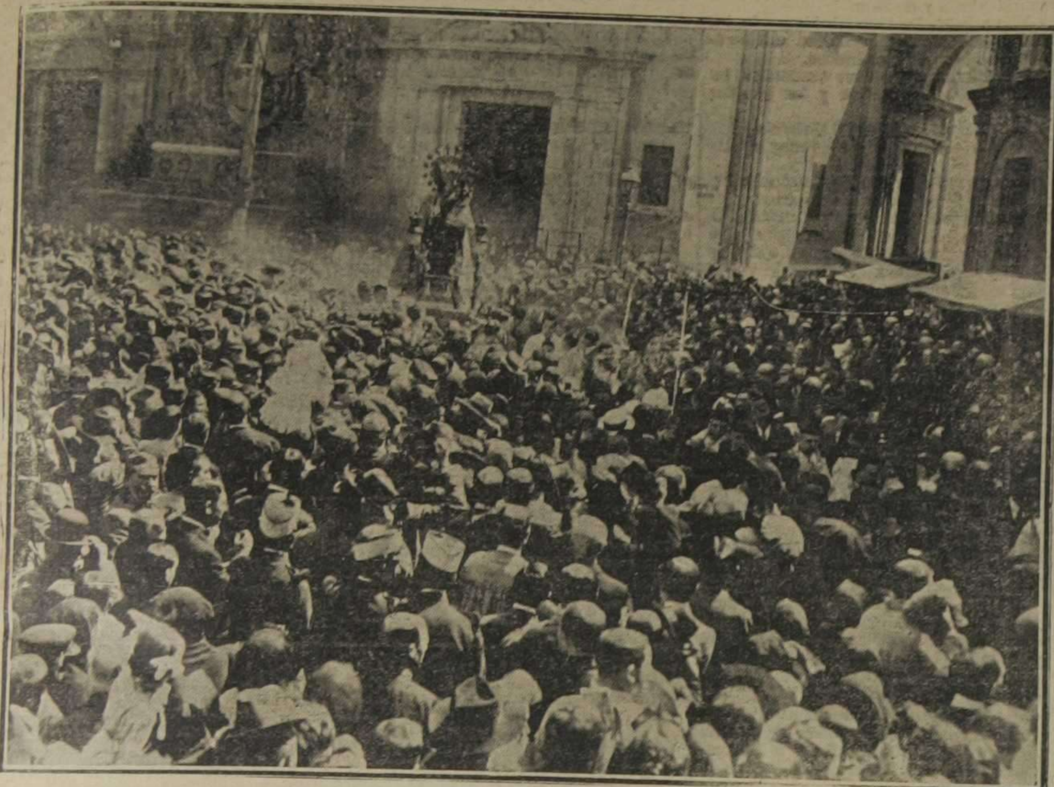
EL TRIUNFO DE LA VALENCIA CATÓLICA