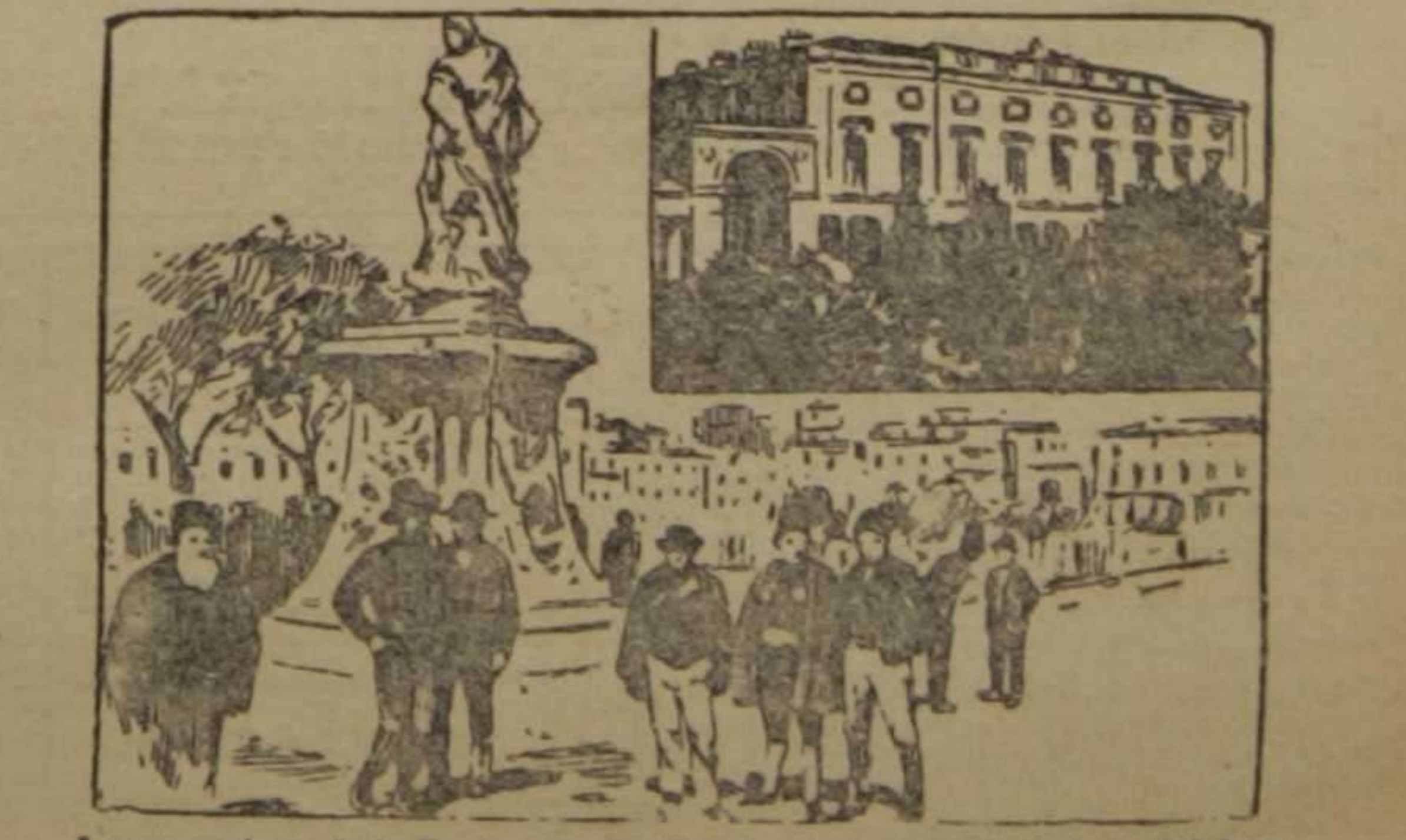
La gran plaza de la Explanada de Corfú.—Antiguo palacio imperial, hoy residencia de Guillermo II