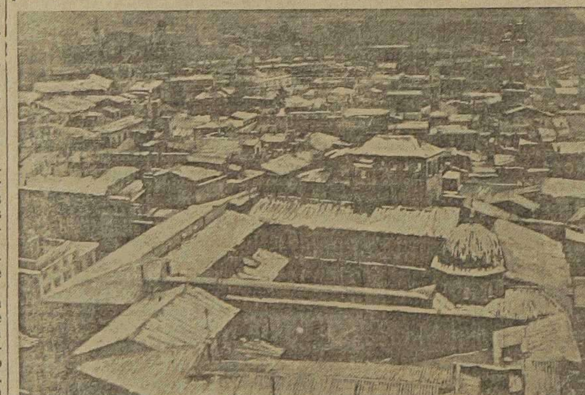
Valencia vista desde el Miguelete

En algunas calles la nieve duró todo el día. En los paseos especialmente, la nieve que cubría árboles y maticos, perduró, a pesar del sol, por la baja temperatura.