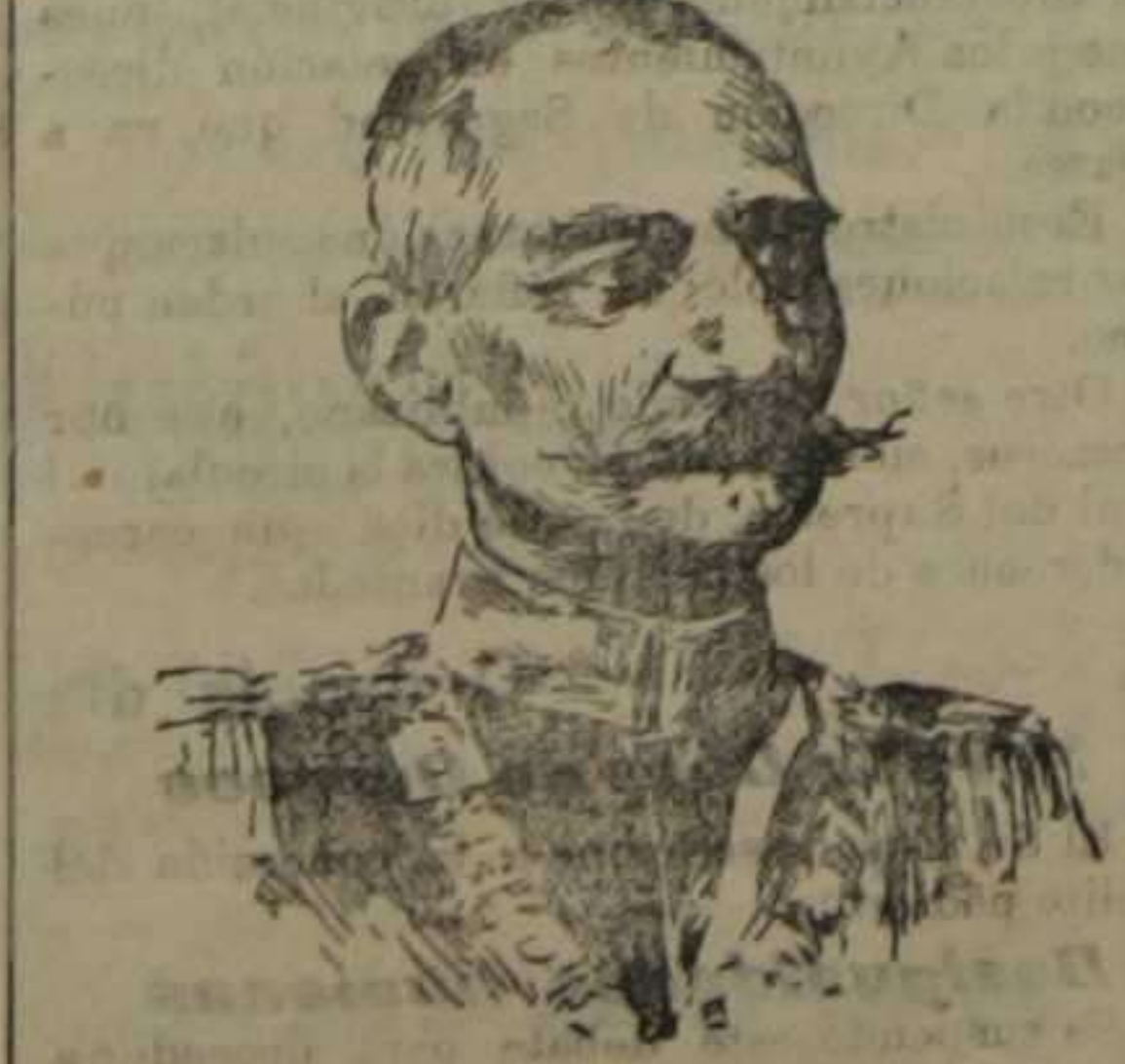
Pedro I de Serbia