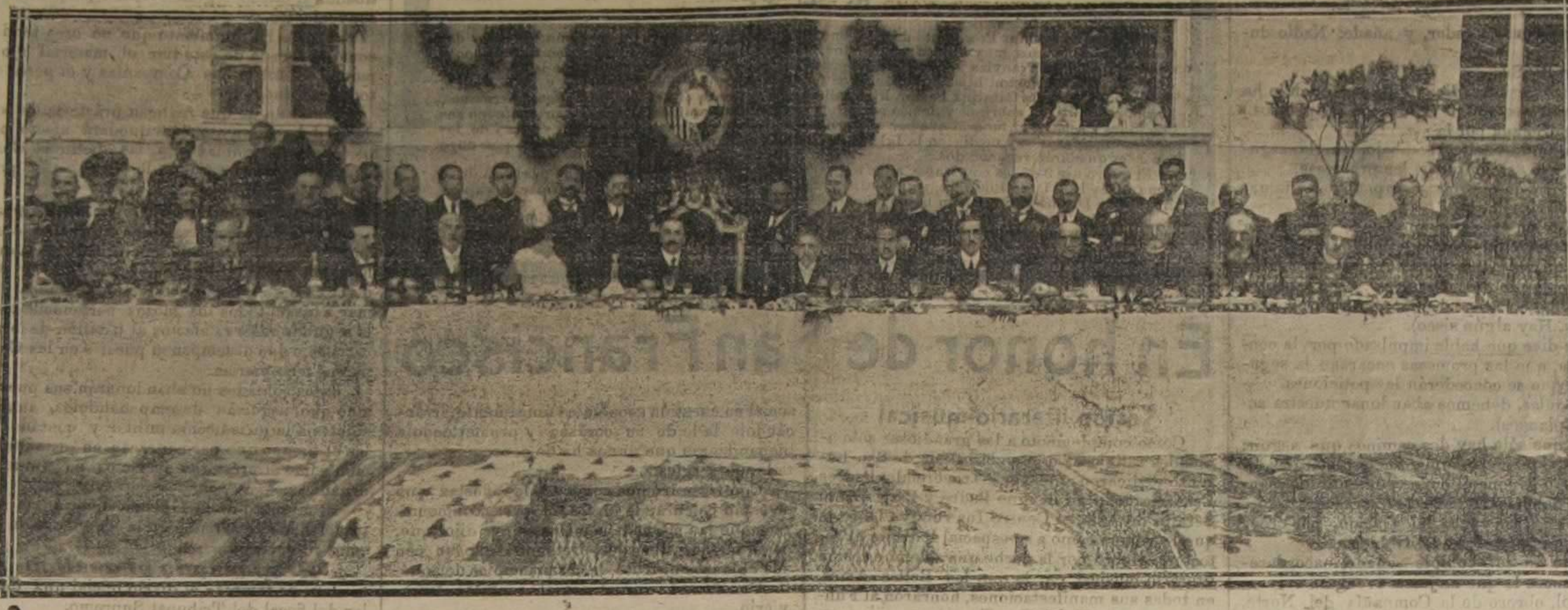
El banquete con que nuestro augusto Caudillo obsequió a los congresistas que de Viena fueron a visitarle