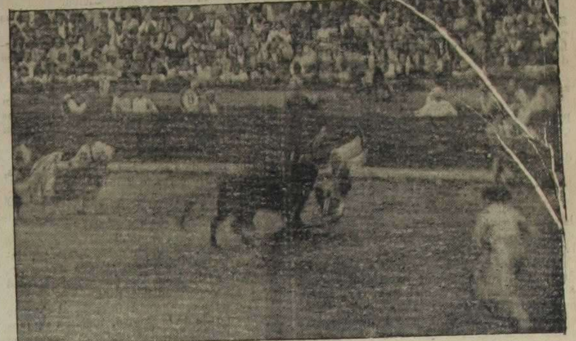
Cogida de Flores.—(Foto. Vidal)

Amarradas en yun a las cuatro parejas hubieran hecho un gran servicio a la agricultura o a nuestros pescadores del Cabañal, pero en el circo de la calle de Játiva sólo produjeron lo que era natural: indignación.