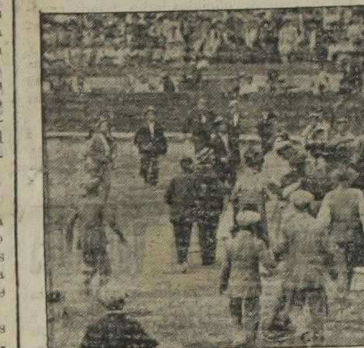
Traslado de Flores a la enfermería.

EL ÚLTIMO TINO A los aficionados les pasa lo que a los jugadores, cuantos más pegos les tiran más se empeñan en apuntar, y no acaban de hacer posturas hasta que los dejan limpios.