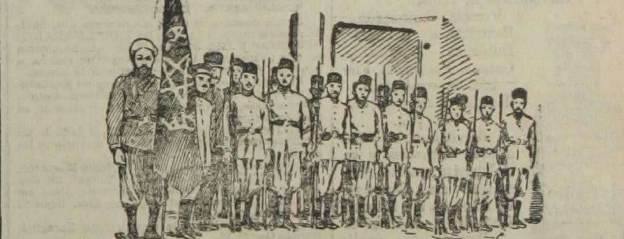
La bandera del labor de policía de Larache, en escolta