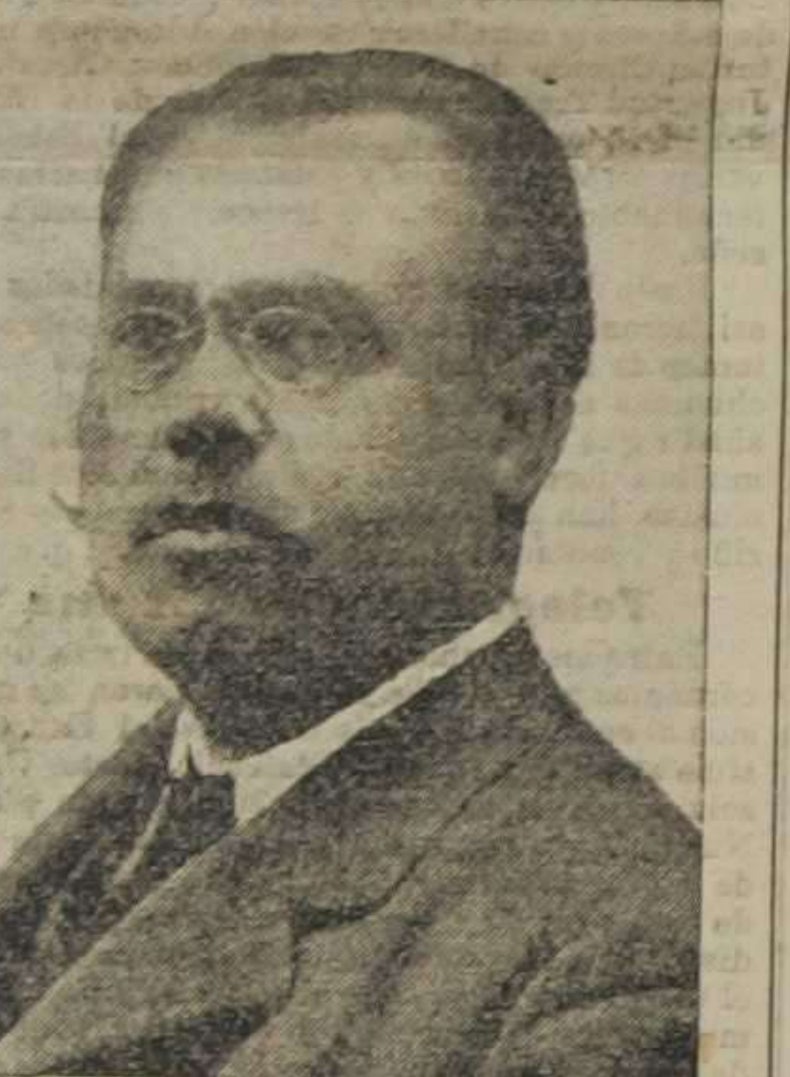
El maestro Lamote de Grignon

Vertical text on the left margin containing various advertisements and notices.