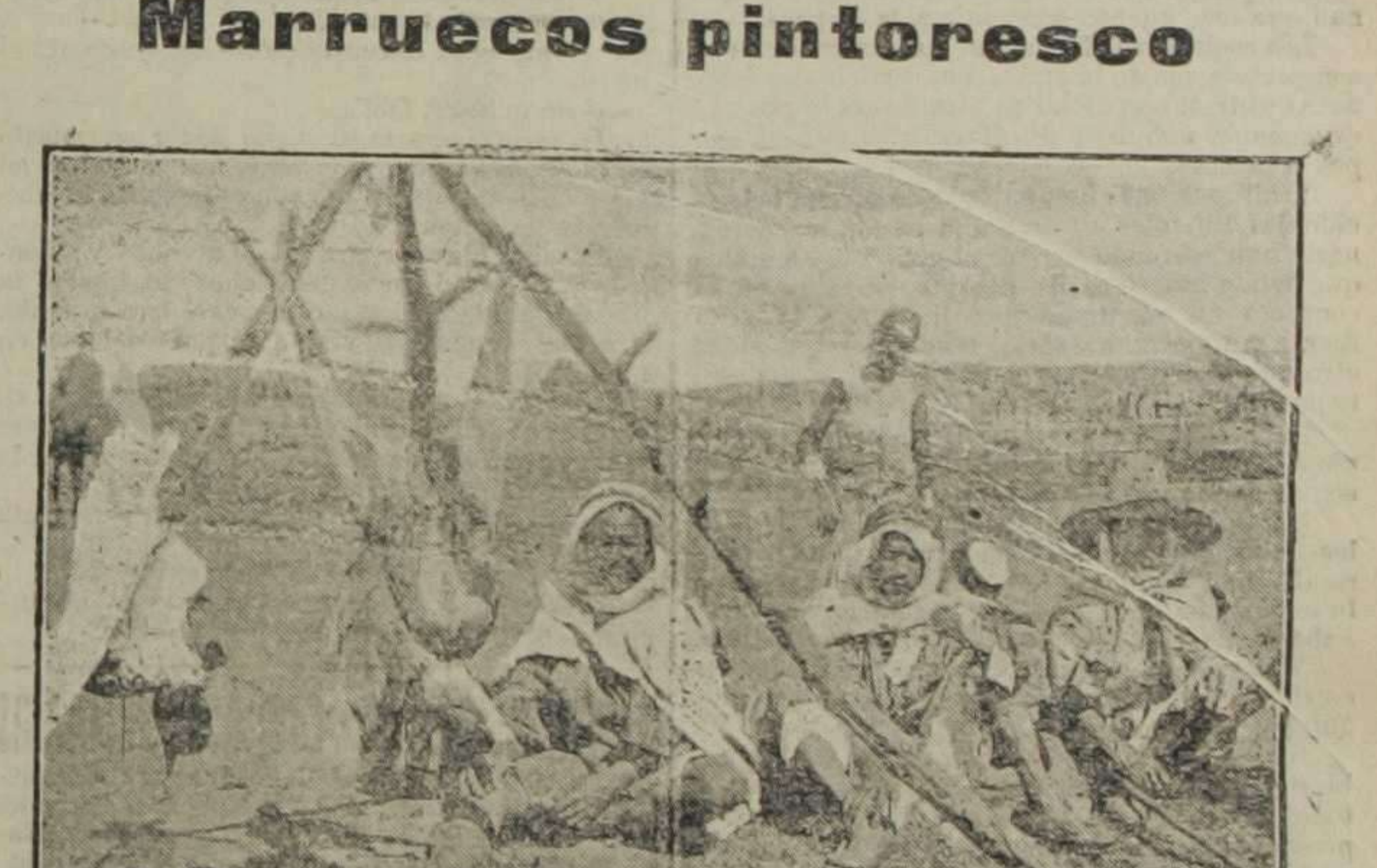
La comida de la caravana