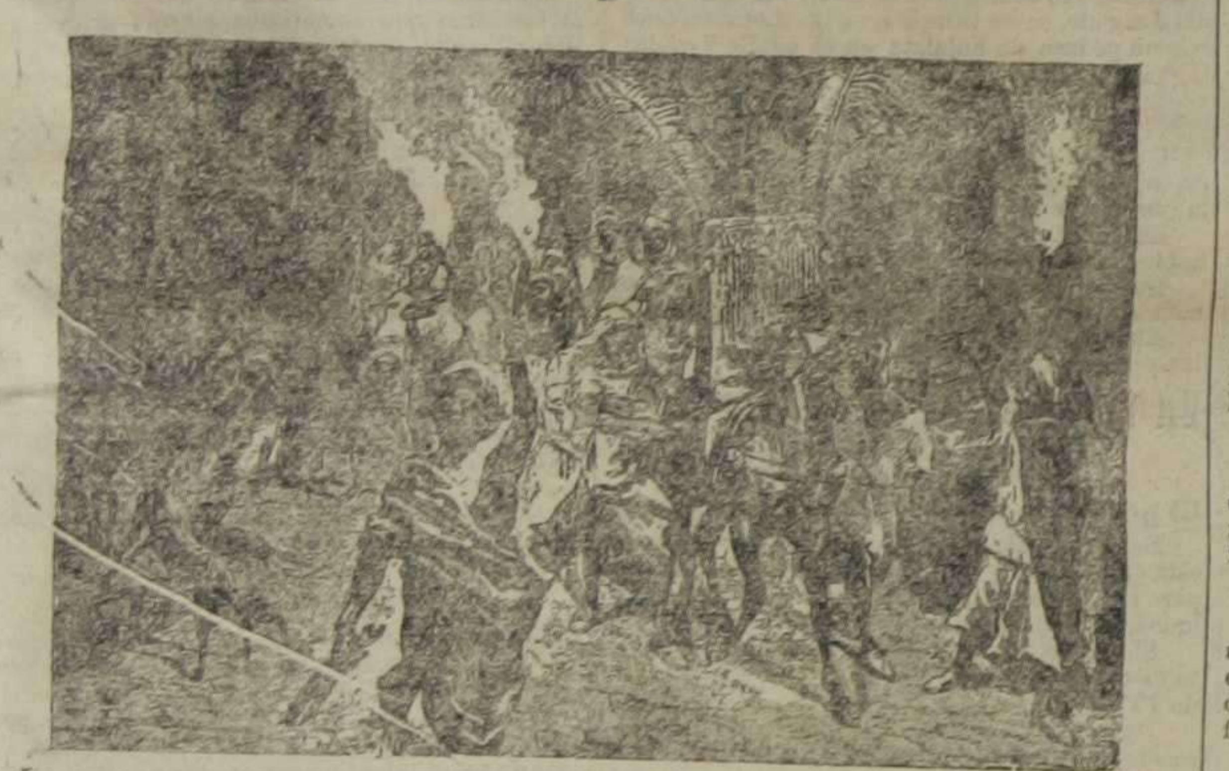
La comitiva acompañando una novia a la casa de su marido