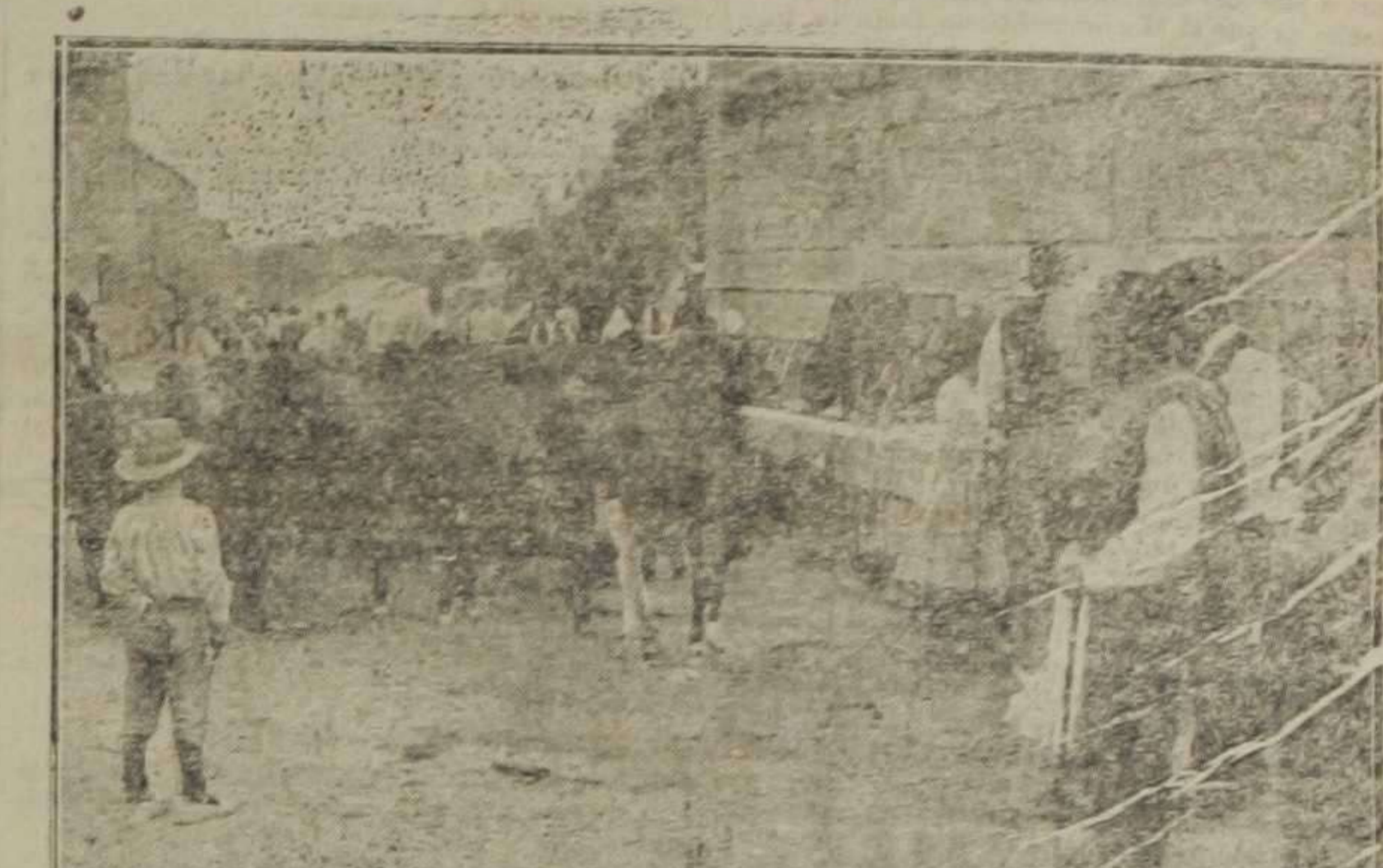
La Feria de Játiva.—Un ganado de terneras abrevando en la fuente de los 25 caños.