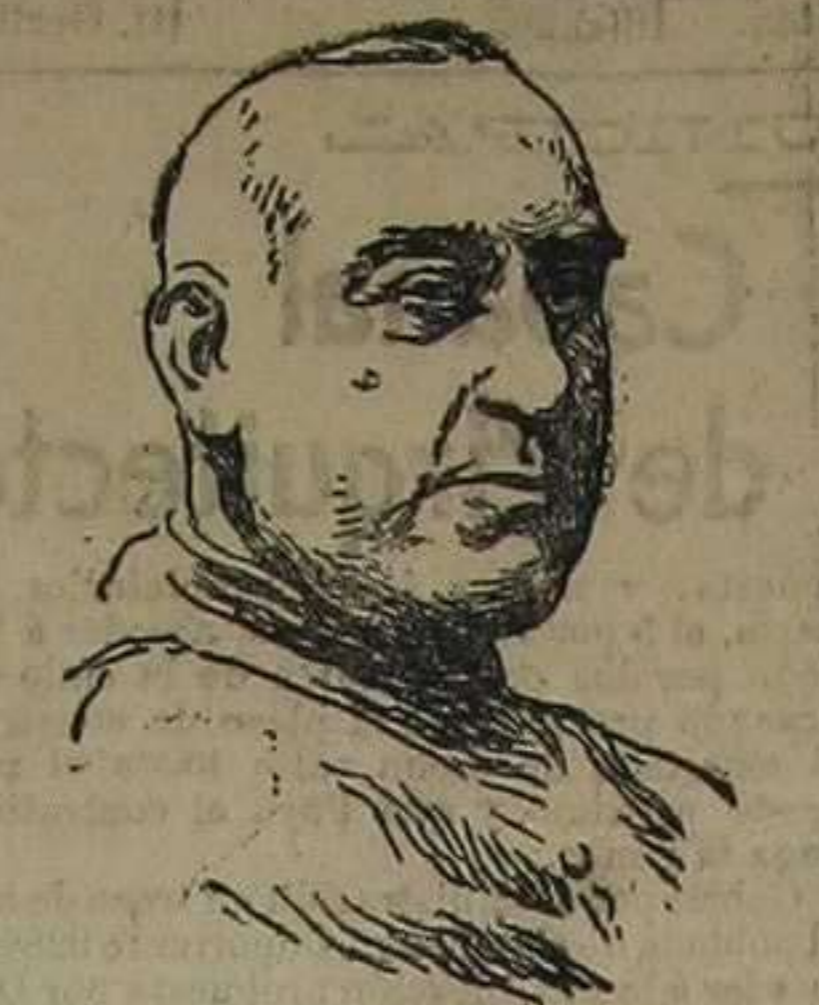
Arzobispo de Zaragoza Con motivo de los capelos vacantes que se han de otorgar en breve, se ha señalado al Sr. Arzobispo de Zaragoza como uno de los más indicados para ascender al cardenalato.