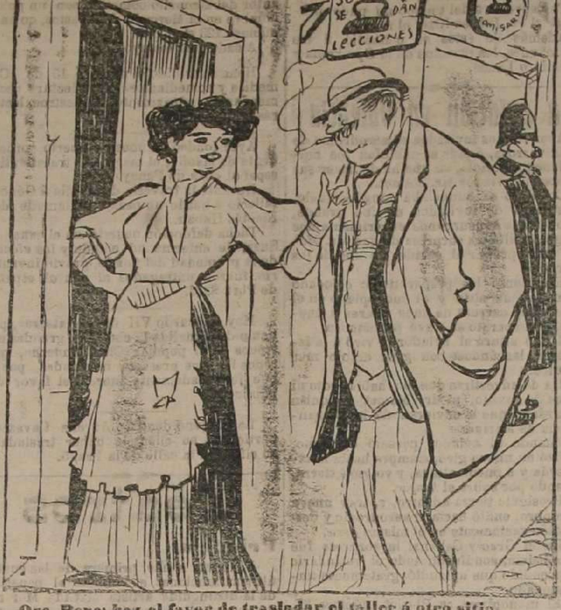
—Oye, Pepe, haz el favor de trasladar el taller á otro sitio. —Por qué? —Pues porque está ahí la "Pali" y soy enemiga de competencias.

de los Derechos del Hombre, acude con todos sus colaboradores, á hacer el "gustatelo" á este Simón de Montfort, en que se transformó avar el que tenemos por abigeos de la democracia española.