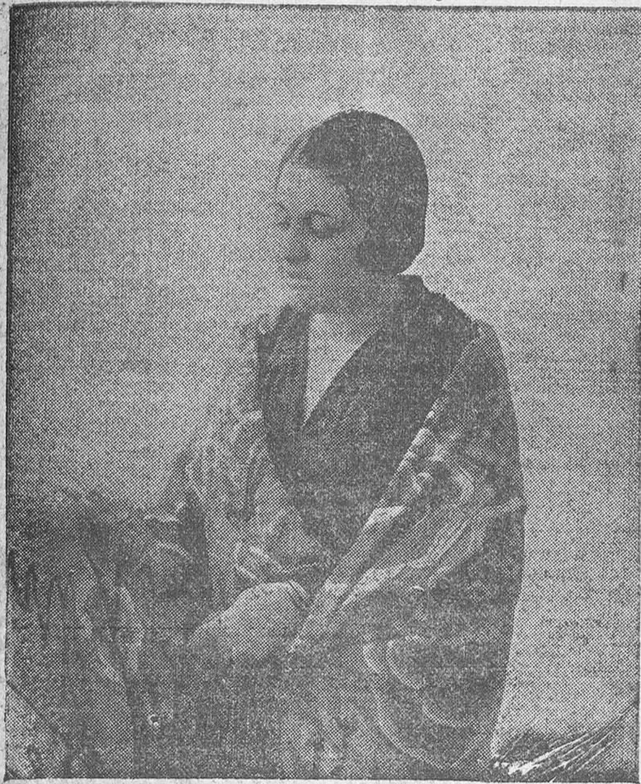
CARMEN DIAZ, LA GRAN ACTRIZ SEVILLANA

te, y Geneveva, la escultora francesa, cuyo amor perfumara la primera juventud de Forestier. La disputa es fuerte y patética entre ambas. La opción, profundamente dramática para el hombre que ha de elegir entre dos patrias igualmente grandes. De un lado, sesenta millones de ciudadanos que le rinden fervoroso acatamiento en el país donde se ha desarrollado el único ciclo de su vida que retiene su memoria; de otra parte, la tierra nativa, donde nadie le espera—ni muchedumbres ni familia ni amigos quizá—mas donde, empero, se ha formado su temperamento y han concebido los im-