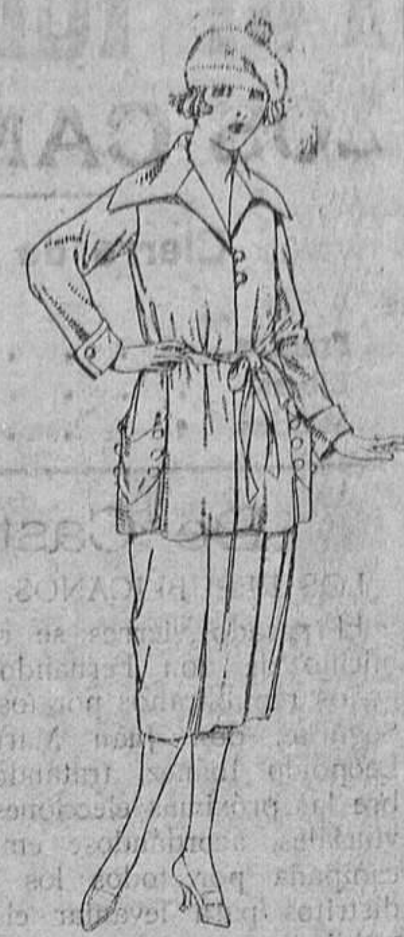
Vestidos de punto de seda, en negro, azul y color. De ptas. 180 á 230.