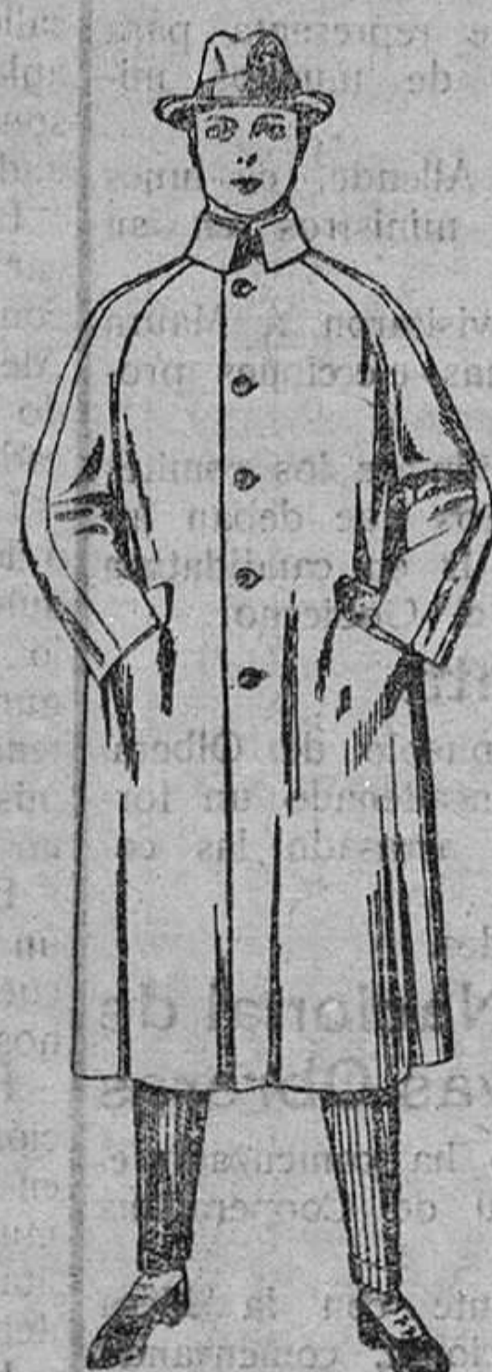
Gabanes de patén, chevrot ó cover. De ptas. 80 á 160.