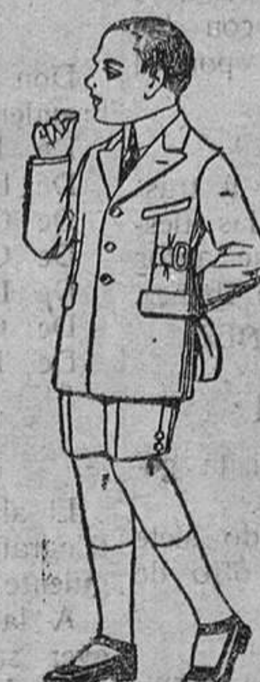
Trajes modelo «Sport», de lanilla, estambre, melton etc., para niños de 7 á 12 años. De 28 ptas. á 50. Trajes-delantal de dril crudo ó kaki, para niños de 3 á 7 años. De ptas. 9 á 15.