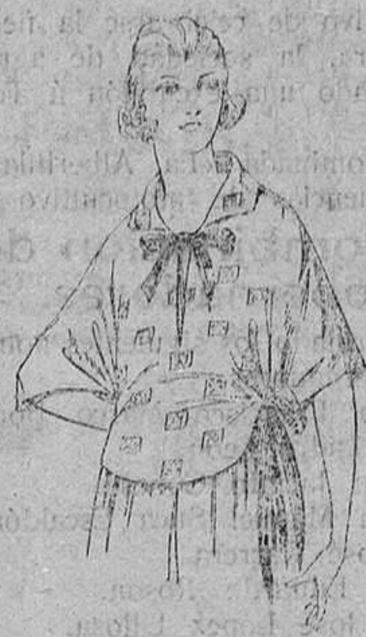
Biusas de crepón de seda, voile y etamín estampado. De ptas. 4 á 25.