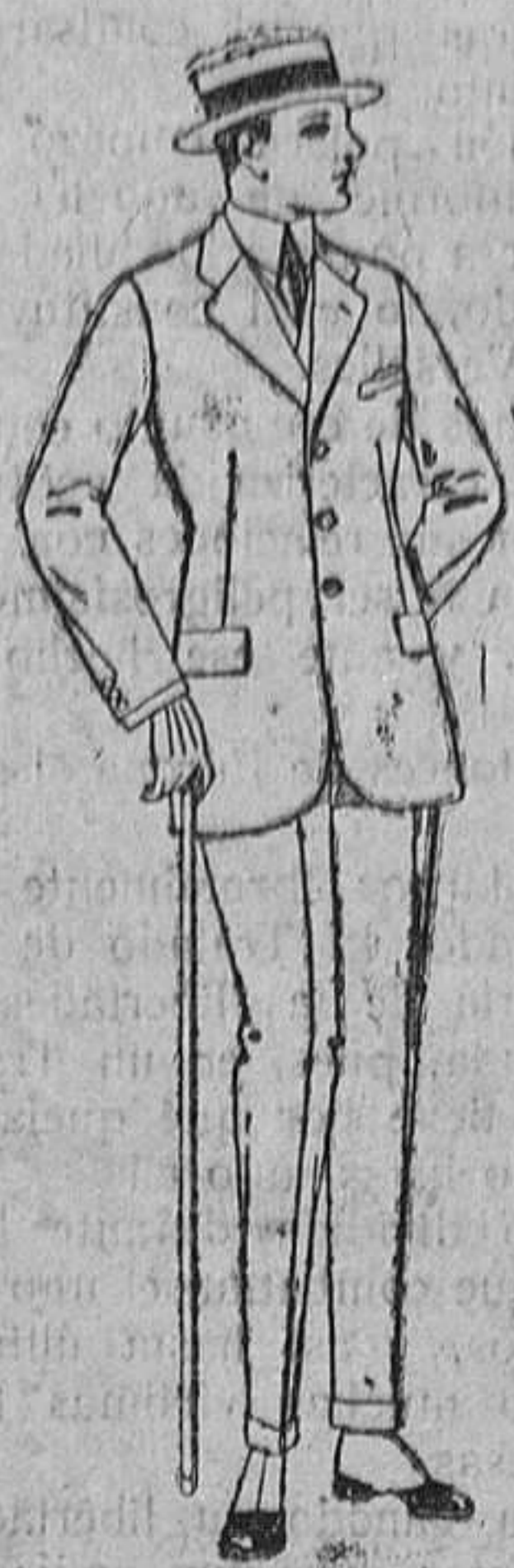
Trajes de lanilla melton, estambre, vicuña ó jerga. De ptas. 38 á 130.

Madrid, Barcelona, Alicante, Almería, Bilbao, Cádiz, Cartagena, Gijón, Granada, Málaga, Palma de Mallorca, Santander, Sevilla, Valladolid y Zaragoza.