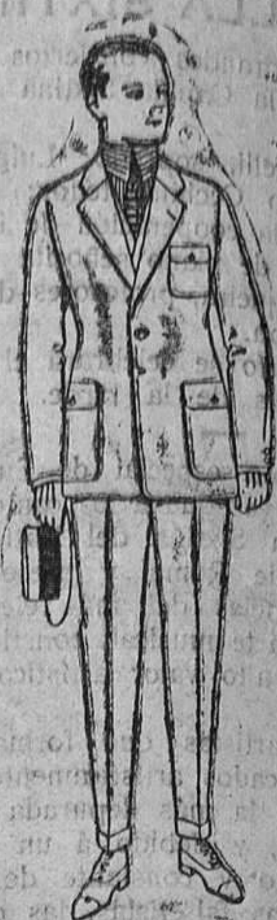
Trajes de dril crudo, kaki ó listado. De ptas. 22'50 á 60. El mismo modelo en estambre «Presco». De ptas. 50 á 140.