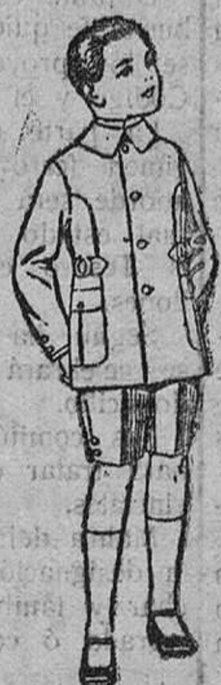
Trajes modelo «Sport», de lanilla, estambre, melton, etc., para niños de 4 á 9 años. De ptas. 20 á 48. Trajes de dril liso ó listado. De ptas. 9 á 18.