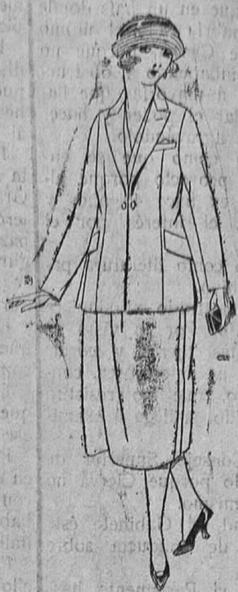
Trajes de sarga inglesa, estambre, etc. en negro, azul y color. De ptas. 150 á 188.