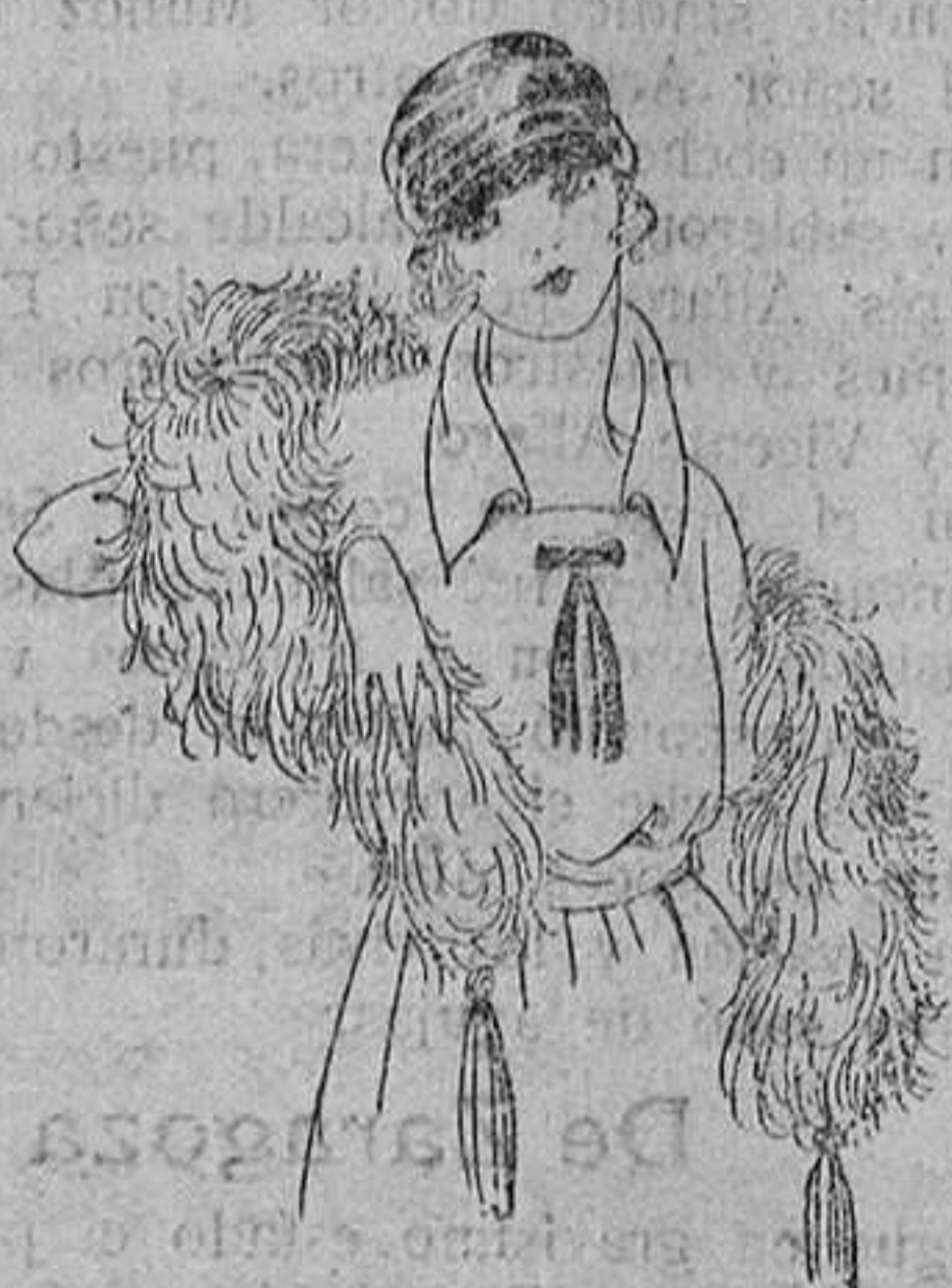
Boas de plumas avestruz, gran variedad en colores y tamaños. De ptas. 15 á 125. Gran surtido de capelinas de marabú. De ptas. 30 á 70.