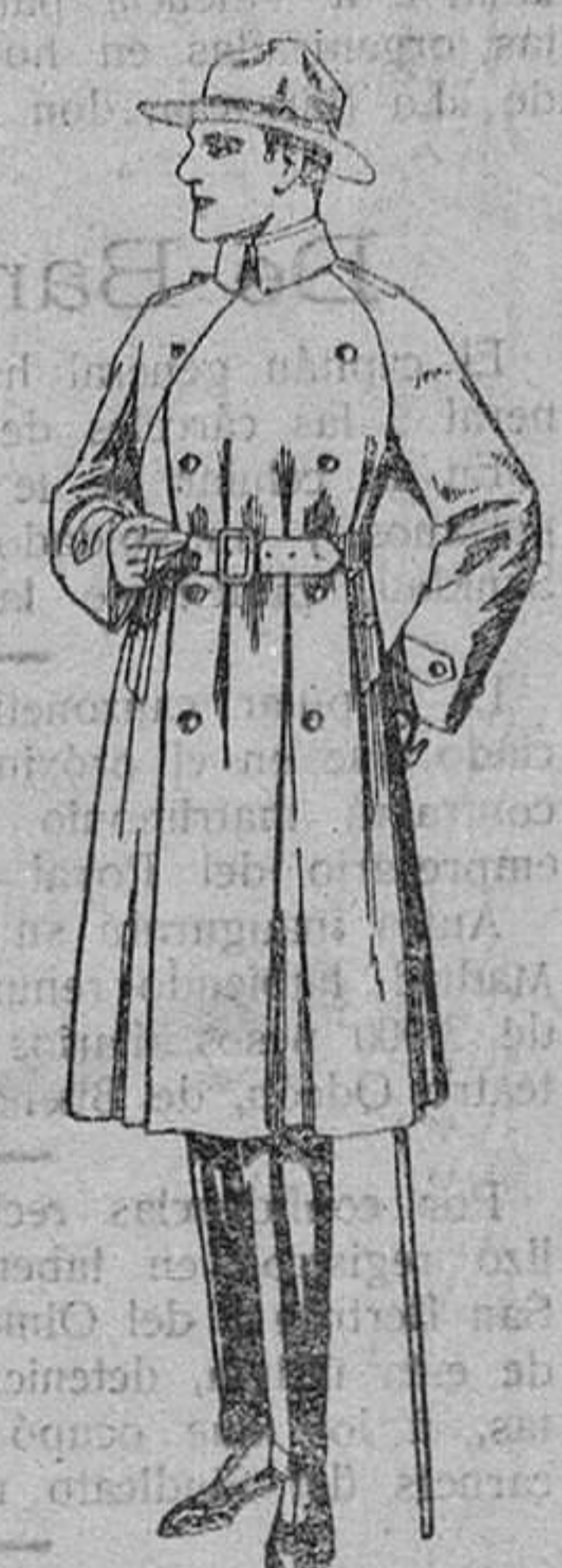
Gabanes impermeabilizados, con cinturón «American trench coat». De ptas. 200 á 350.

Boas, Camisería, Géneros de punto, Corbatería, Guantería, Sombrerería, Zapatería, Paraguas, Bastones, Sombrillas y Artículos de viaje.