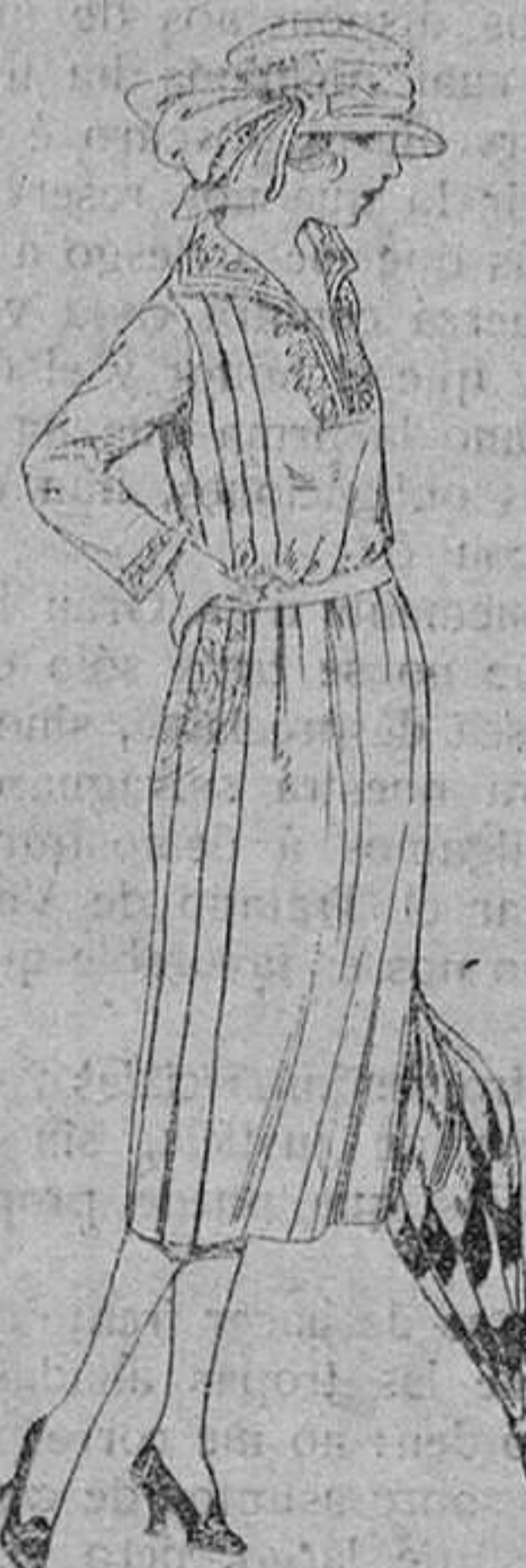
Vestidos de gabardina, sarga inglesa, etc., en negro, azul y color, adornos bordados. De ptas. 110 á 130.