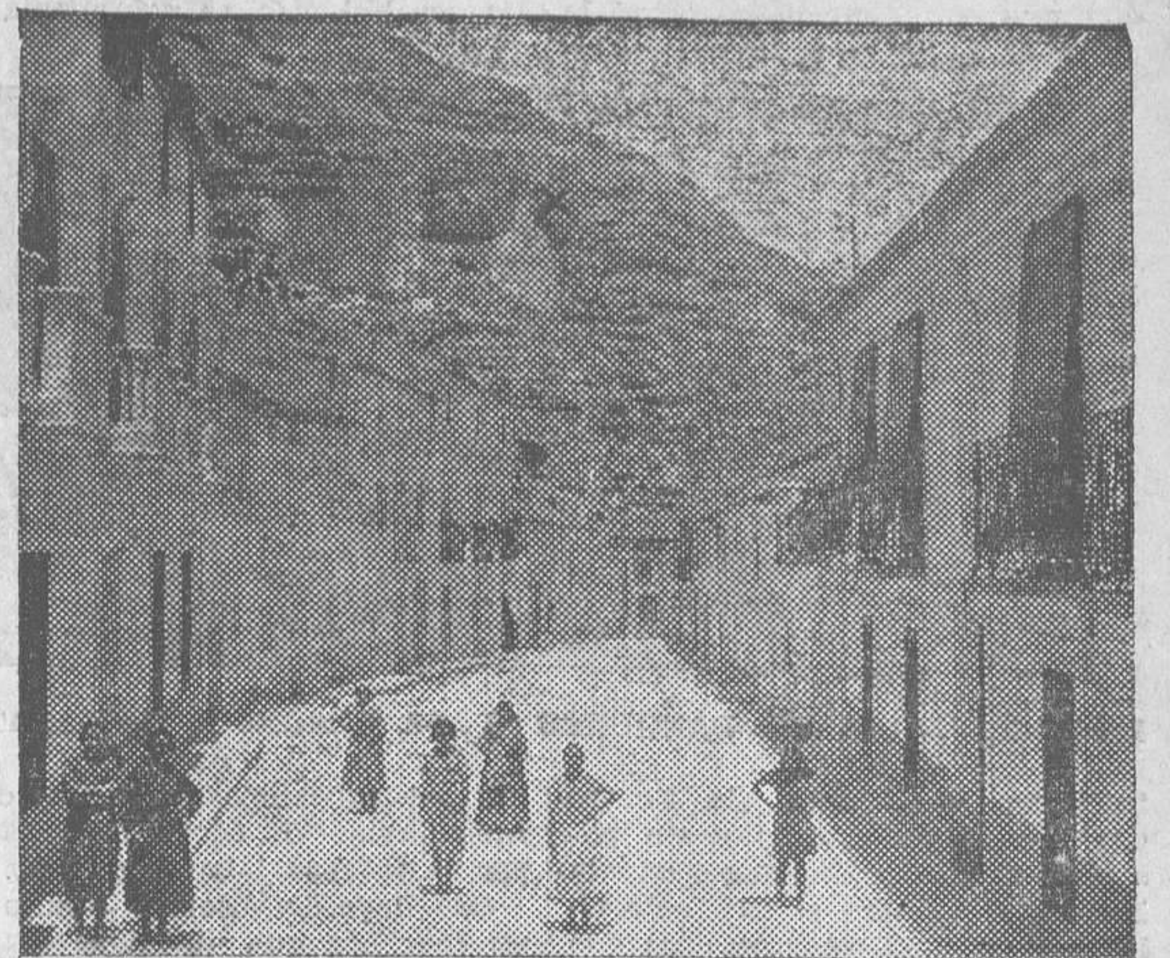
AL FONDO, EL PEÑON QUE AL DERRUMBARSE HA CAUSADO LA TRAGEDIA