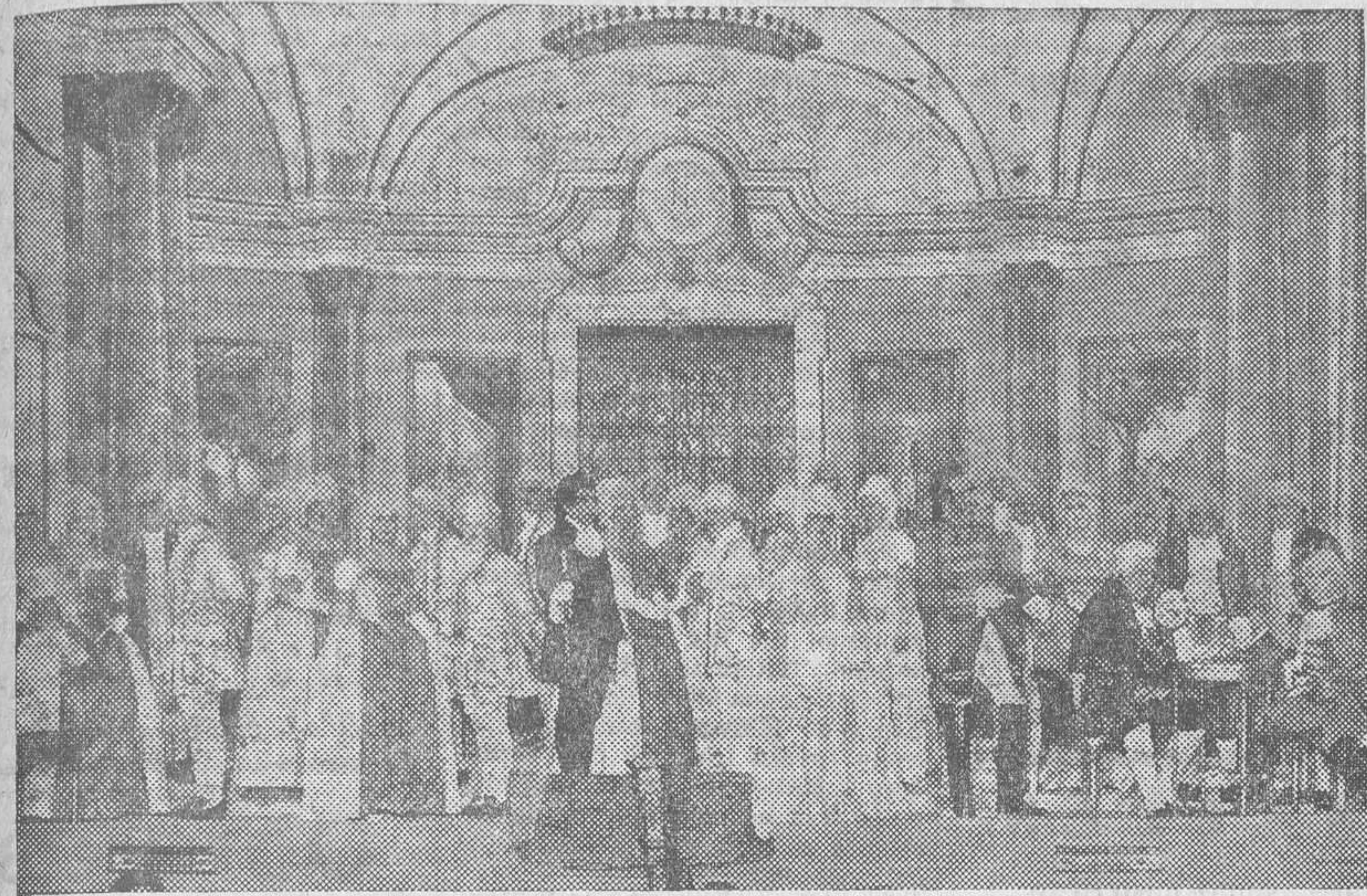
UNO DE LOS MOMENTOS MAS INSPIRADOS DE LA PARTITURA. LA PARTIDA DE CARTAS DEL CUADRO SEGUNDO DEL ACTO PRIMERO.

Y tras caldearse el ambiente, al alzarse el telón, de nuevo la ovación sonó atronadora ante la fa-