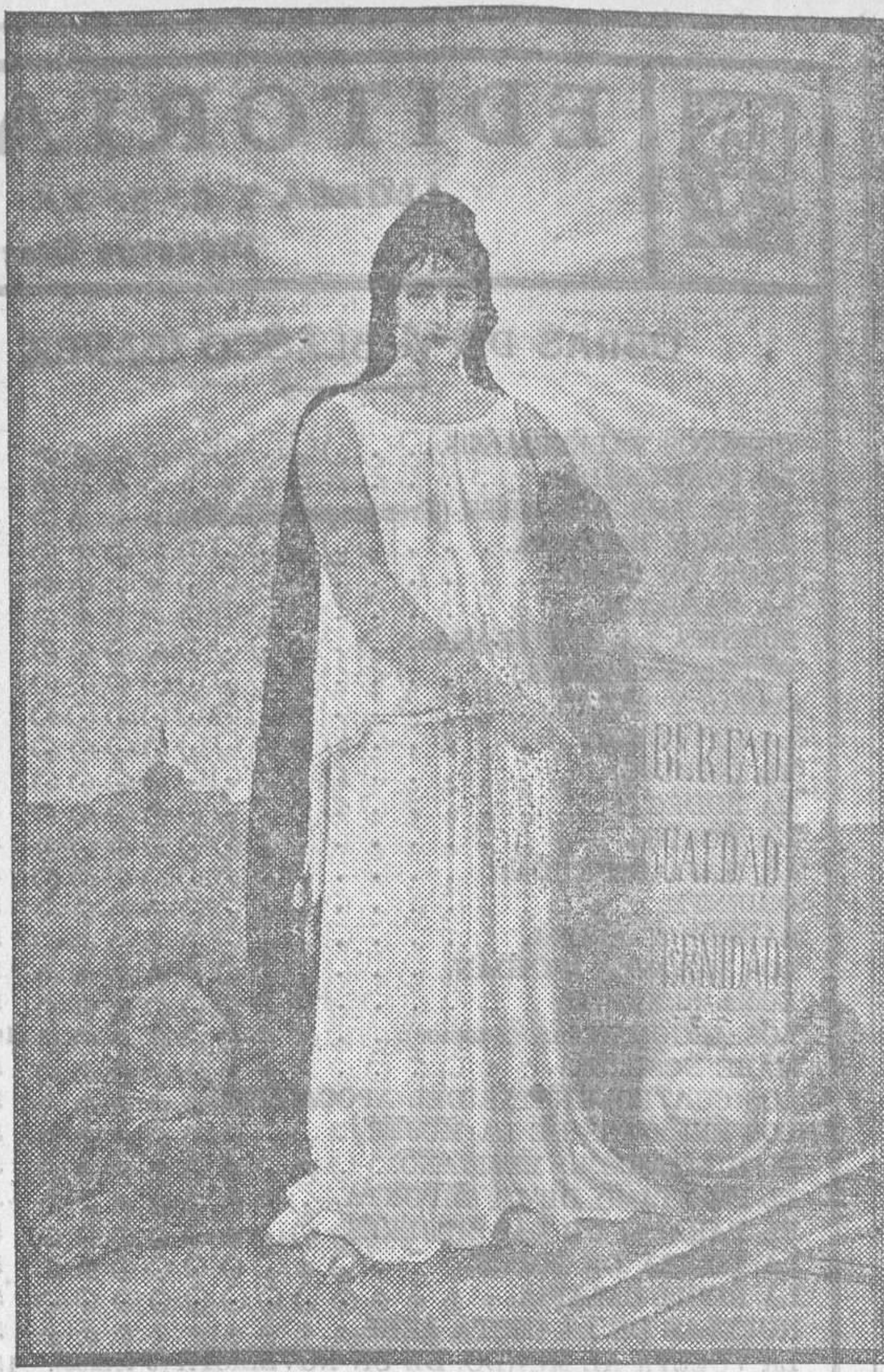
Tamaño 77 por 110, ocho ptas.; tamaño 54 por 34, seis ptas.

(Procedimiento OFFSET.—Símil aguafuerte) La alegoría más indicada para ayuntamientos, diputaciones, juzgados, oficinas del Estado, centros republicanos, etc., etc.