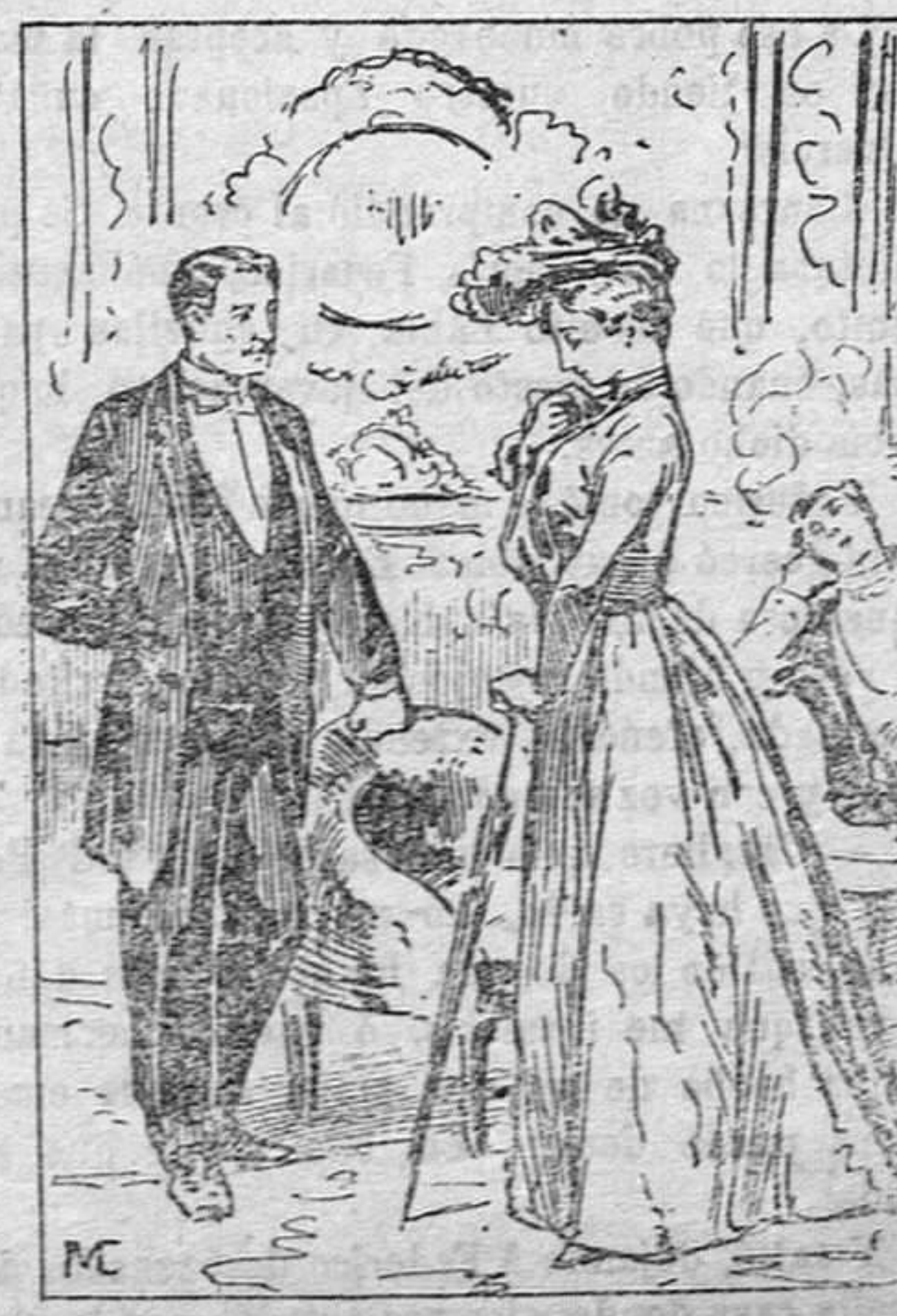
¡Era la última de las ignominias! ¡Adiós! (Pág. 395)