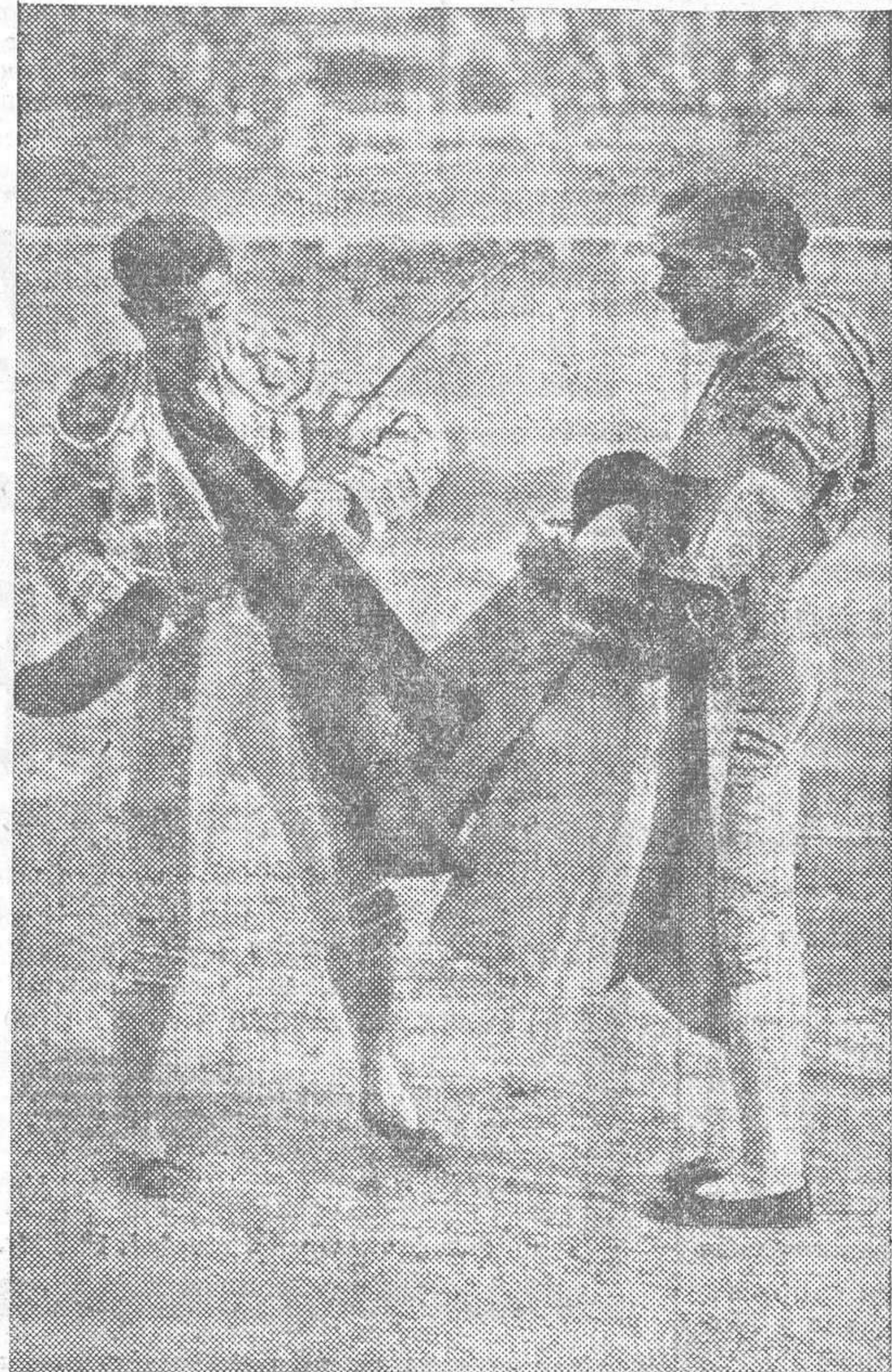
EL DIESTRO MARCIAL LALANDA CONCEDIENDO LA ALTERNATIVA A ALFREDO CORROCHANO

limpios de egoísmos, se incorporaba al elenco de las notabilidades. ¿Para llegar a serlo? ¿Por qué no? El toque está en no asustarse de los toros, en pararlos y apuntar personalidad de torero en cuanto se ejecuta. El dominio, si ha de llegar a conseguirse, viene luego. Omitimos el estilo, porque a cuenta de este comodín se han colado los frescos con gracia en el escalafón de categoría.