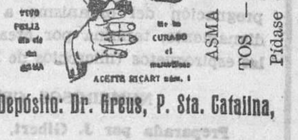
Depósito: Dr. Breus, P. Sta. Catalina.

Por las enseñanzas que de esta conferencia podrán deducirse, el Instituto Médico Valenciano invita para dicho acto a las profesiones sanitarias y alumnos de Medicina y Ciencias.