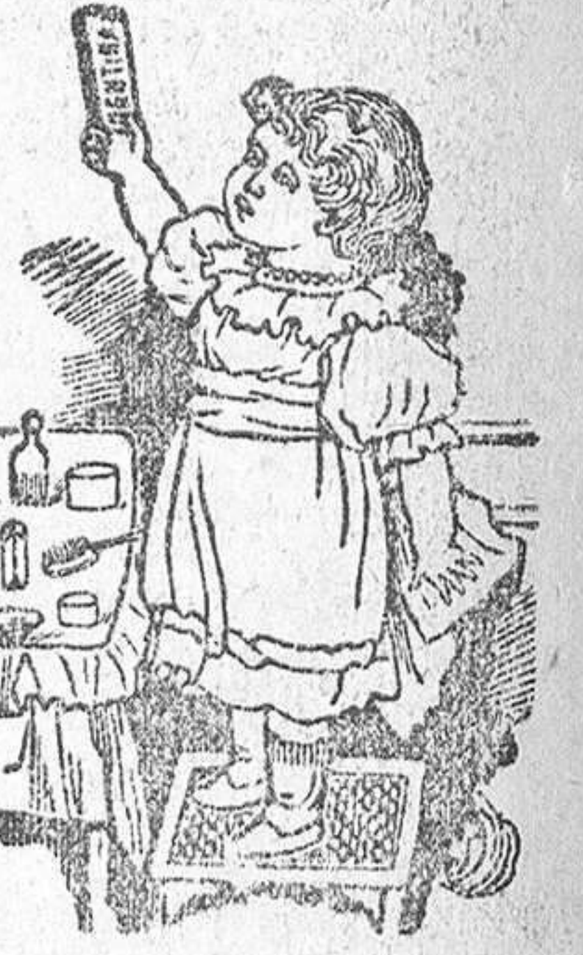
CAJA-ESTUCHE, 1,25 PESETAS