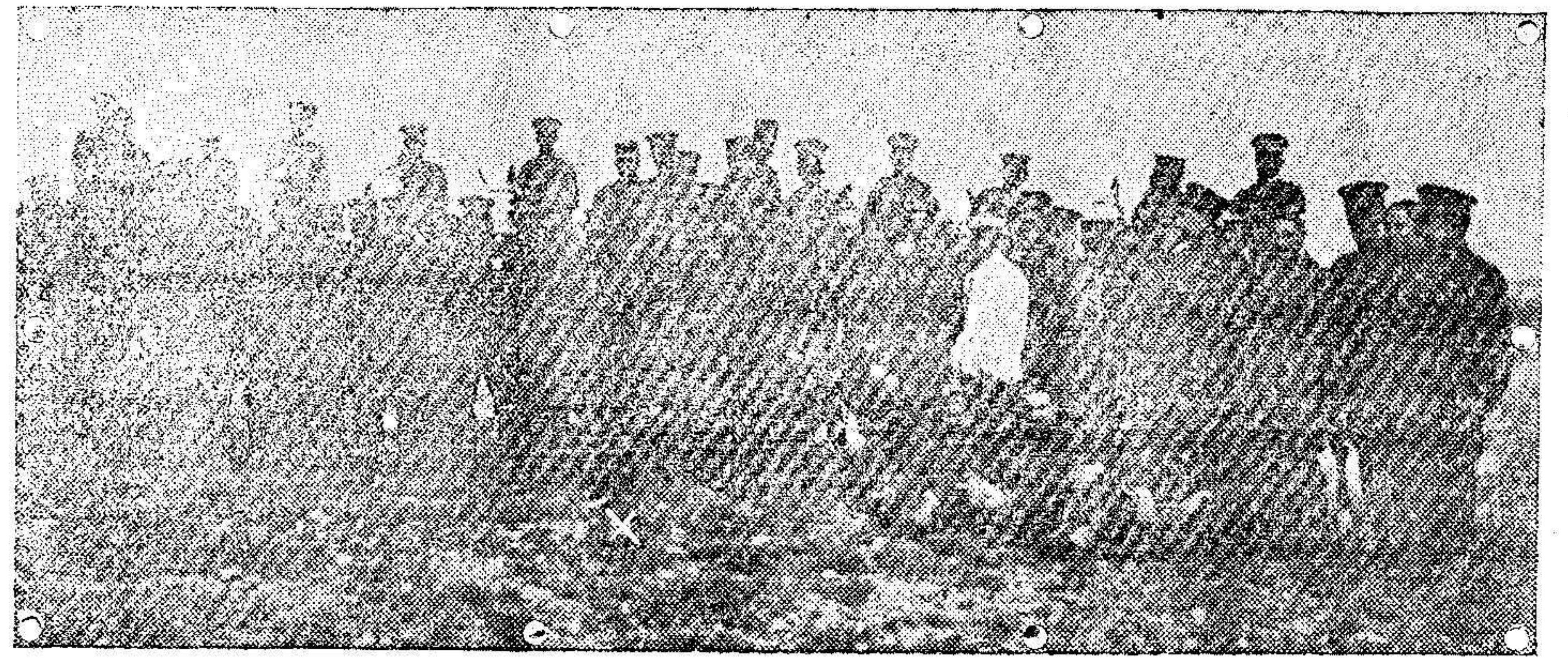
CURSO DE TIRO EN VALDEMORO.—El general Aranz con varios profesores de la Escuela y los jefes y capitanes que asisten, presenciando un ejercicio.

El viejo esplendor lo conservan las ige-