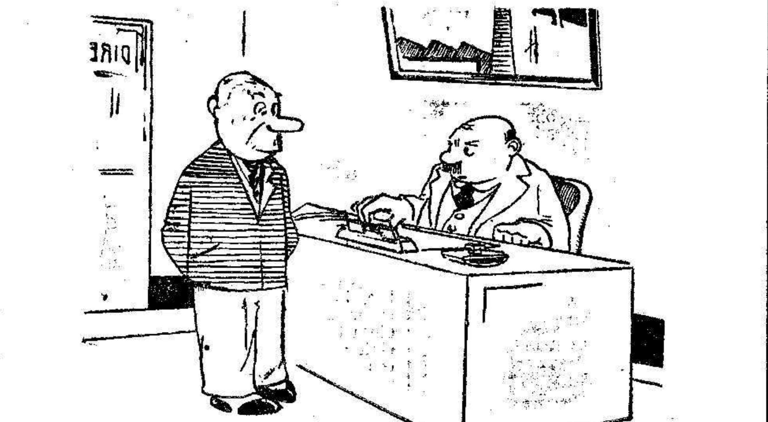
—Por qué no ha venido usted antes a que le diera la cartilla de parado? —No he tenido tiempo, porque estos días ando de cabeza con un trabajo loco...