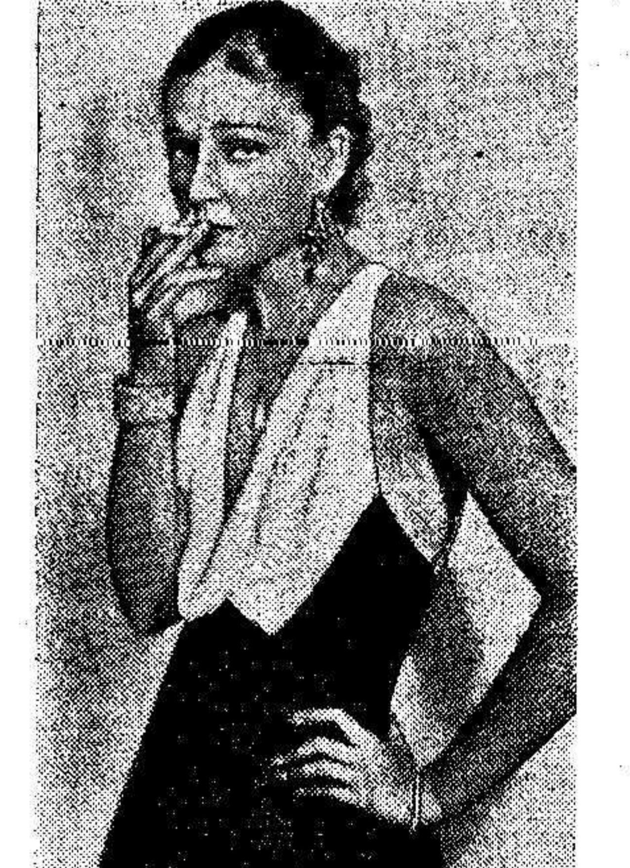
Todas las estrellas de cine europeas que se dejan arrastrar hacia Hollywood, sufren súbitamente cambios sensibles en su físico, tomando un aspecto más interesante. La foto muestra a Anna Sten, la actriz rusa, que no parece ser la misma que aparecía en las películas alemanas.