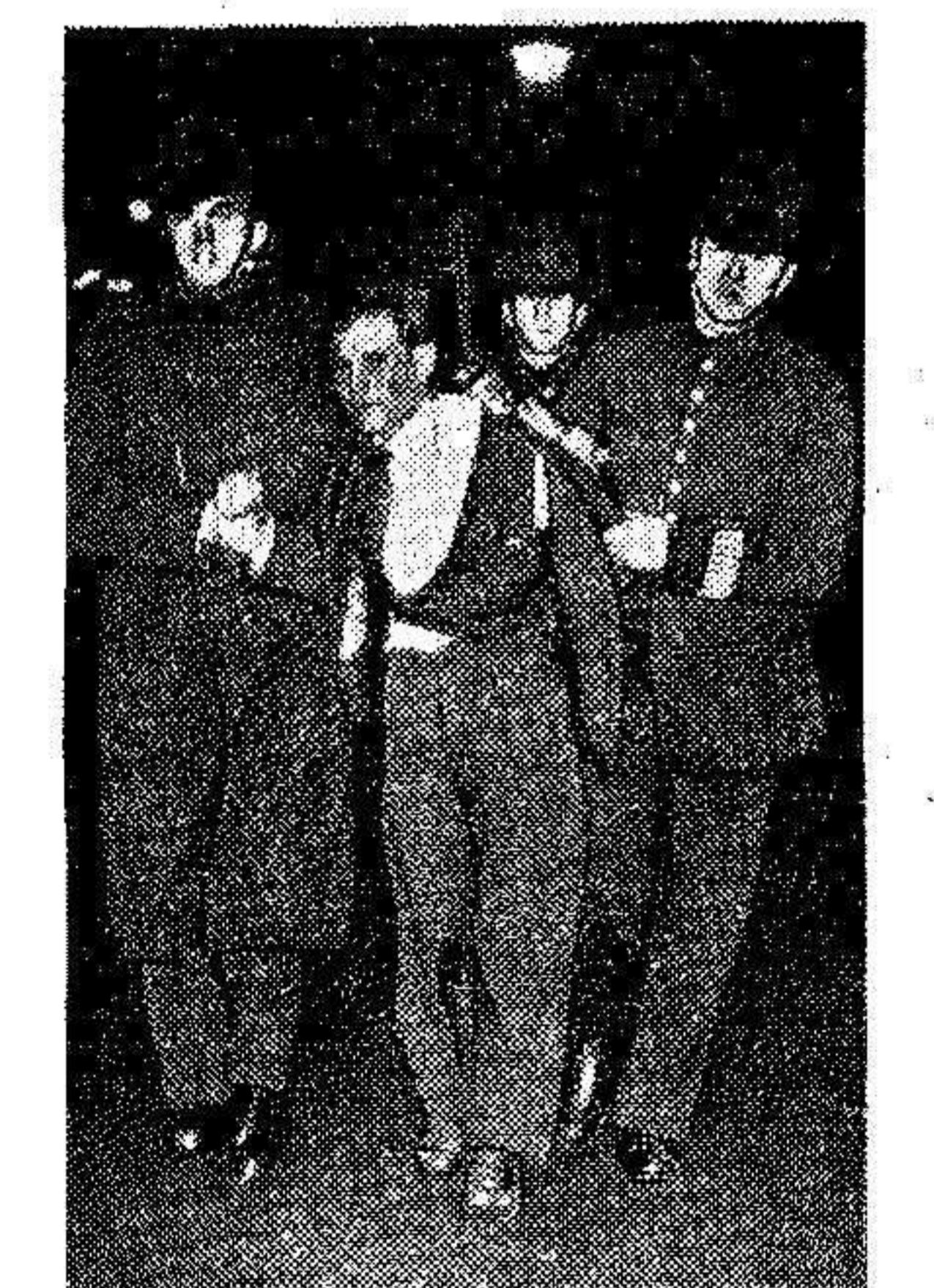
Los parates ingleses, llegados de todas partes del país, se han reunido en Londres para hacer demostraciones que llegaran a causar colisiones con la policía. La foto muestra a un detenido, conducido por los agentes.