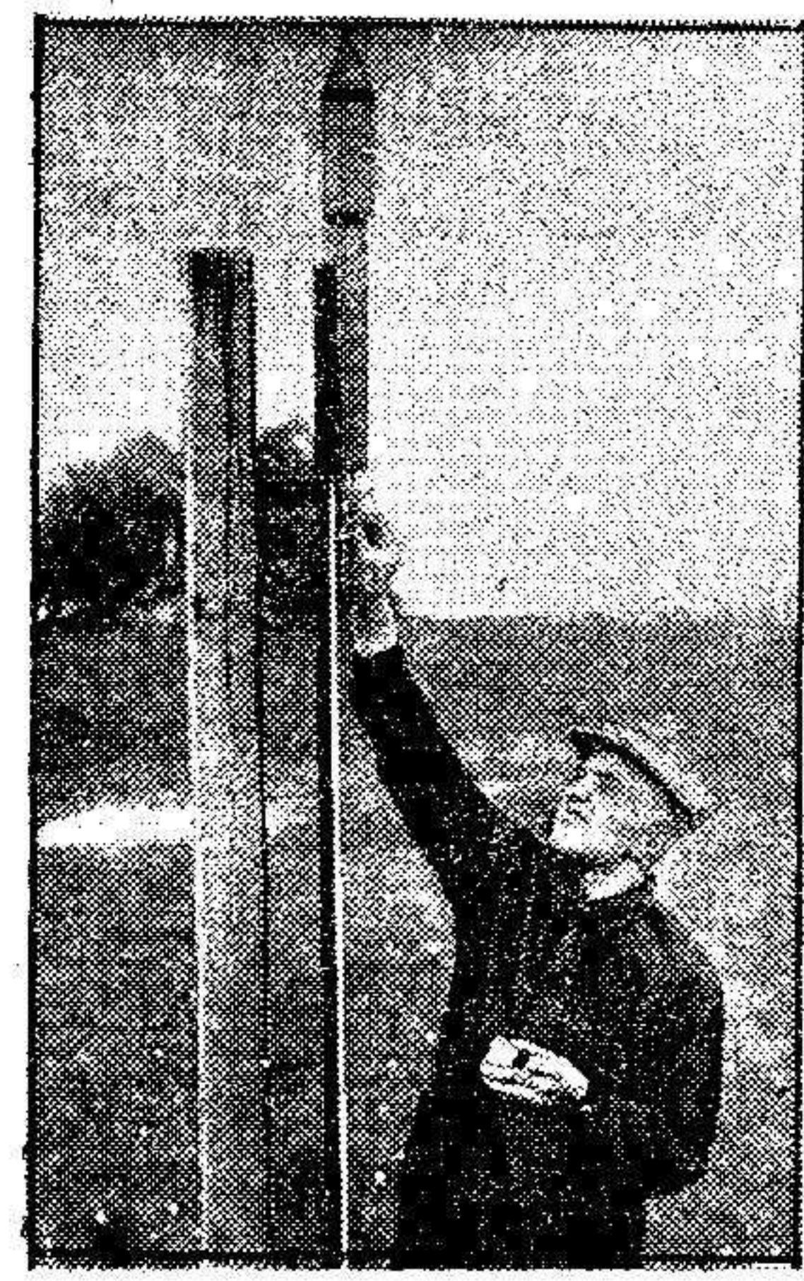
En Baviera cuando una tempestad de granizo se aproxima, los habitantes se lanzan a proteger sus campos, lanzando al aire cohetes contruidos especialmente para este objeto. A causa de la explosión las nubes, quedan dispersadas y neutralizadas.

Dentro de breves días saldrá para Tetuán una comisión de la Junta Vecinal del poblado de Zoco El Arbaá de Arkemán, con el fin de someter al Alto Comisario un índice de sus necesidades. Reconocen los comisionados el que no todo ha de confiarse al esfuerzo del Majzen, así como el que las Juntas Vecinales deben atender a crearse una hacienda saneada, que les permita mejorar paulatinamente y con sus propios recursos la situación de los poblados. Por ello a las peticiones se acompañan soluciones armónicas, teniendo en cuenta que algunos de los proyectos son de tal envergadura que, sin el auxilio oficial nada podría hacer la citada Corporación, a pesar de sus buenos deseos. Edificio para la Junta Vecinal; cesión de los terrenos Majzen enclavados en su término vecinal; arreglo de la carretera Tahuima-Zoco El Arbaá de Arkemán-Cabo de Agua; muelle de embarque y desembarque; escuela de la que carecen en el poblado; y abastecimiento de agua son las aspiraciones de aquel vecindario, con soluciones prácticas, como decimos, para llevarlas a una realidad próxima. Celebraremos con las gestiones de esa Junta Vecinal obtegan la favorable resolución que merecen.