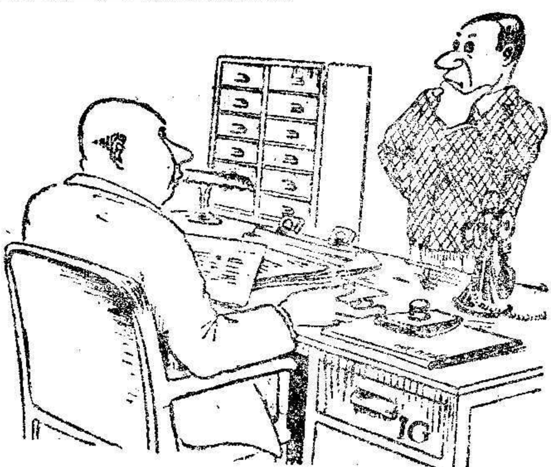
¿Qué ha pasado que aún no ha llegado el vapor correo de hoy? —Debe haber sido asesinado en el camino.