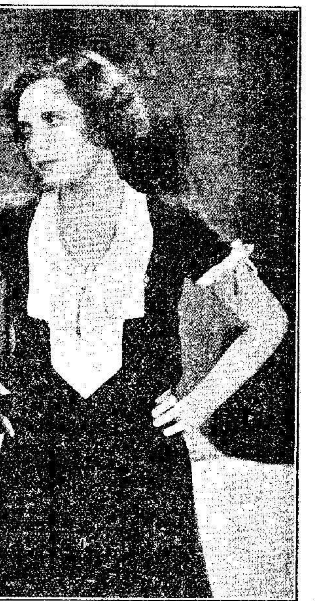
Una escena del film parlante en inglés, de la casa Bencairento. Film «Libertad condicional».