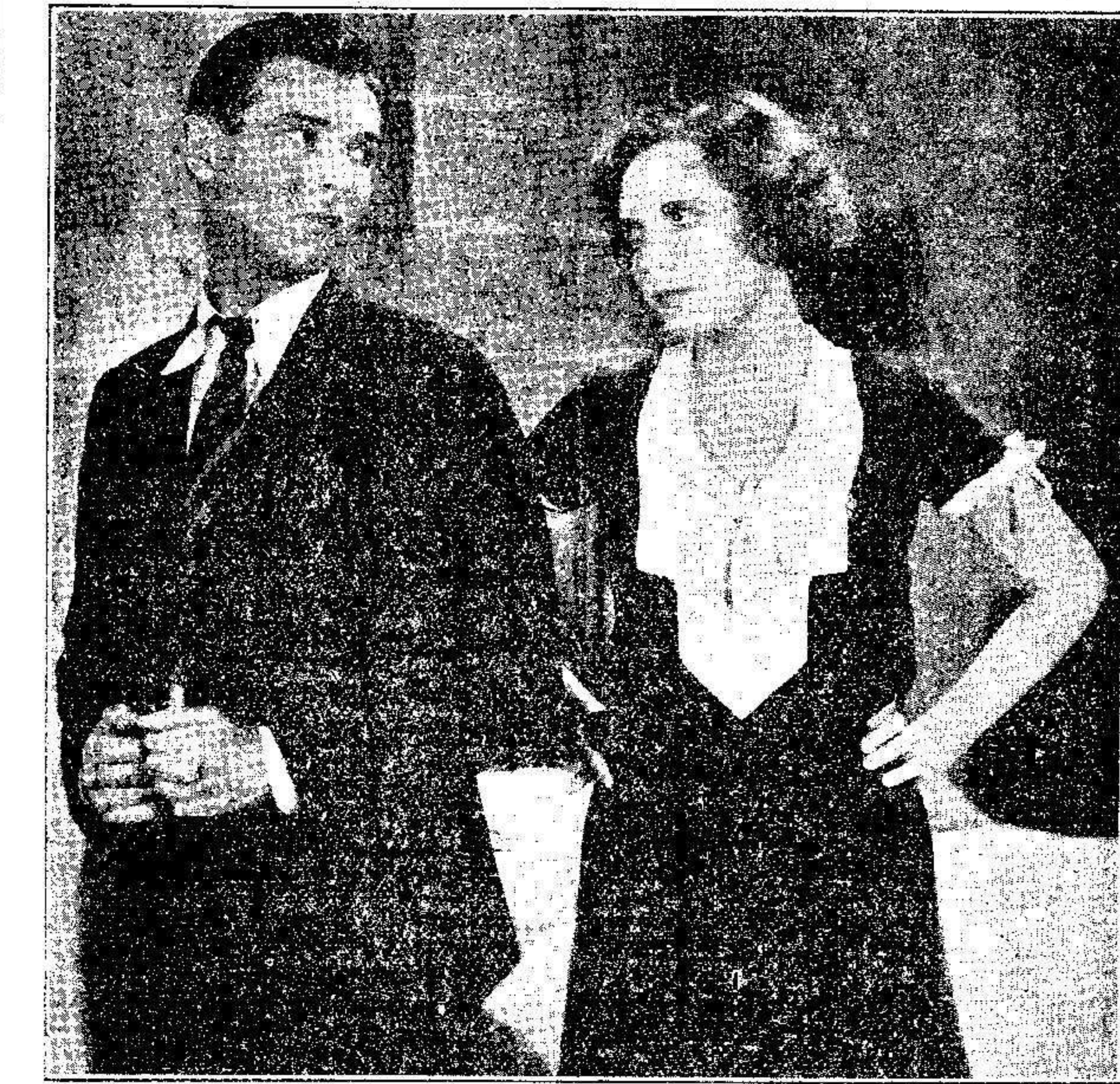
Una escena del film parlante en inglés, de la casa Bencairento. Film «Libertad condicional».

Los ingenieros de Hollywood han perfeccionado un micrófono submarino tan sensible que puede registrar los sonidos más débiles a muchas brazas de profundidad, y sin embargo, tan sólido, que puede resistir las grandes presiones del agua a que se le someta. Fué di-