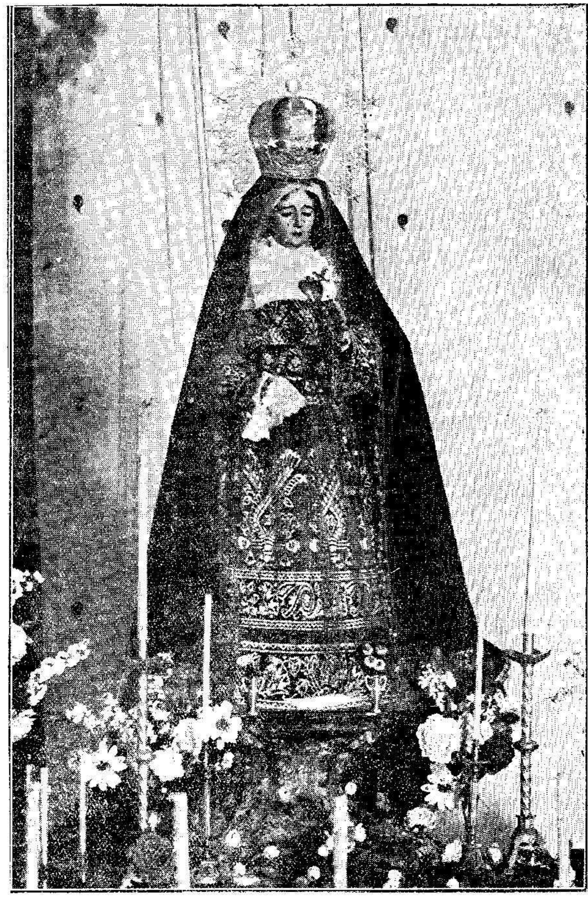
Bella imagen de la Dolorosa, ante la cual los antiguos católicos melillenses se postrocaron muchas veces impiorando los dones divinos, en sus frecuentes visitas al templo de la Purísima Concepción, Residencia de los RR. PP. Capuchinos.

A las nueve, Oficios propios del día Adoración de la Santa Cruz y sermón de Pasión; a las tres y media de la tarde, solemne Via-Crucis cantado; a las cinco y media, Maitines de Bineblas cantados y al final sermón de Soledad.