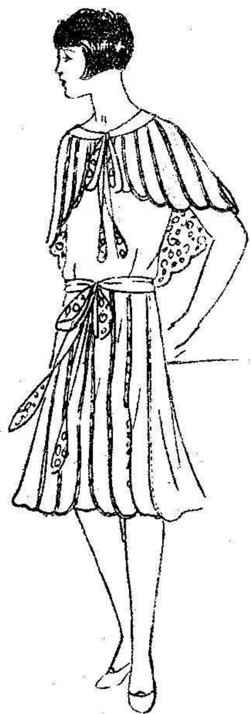
Interesante creación para juventud

Pero bajo Luis XIV, nacerán los puntos finos que durante cierto tiempo serán designados simplemente con el nombre de Punto de Francia. El Punto de Venecia se transforma incorporando el Punto de Ragusa y se llega pronto a obtenerlo perfectamente en Francia. Col-