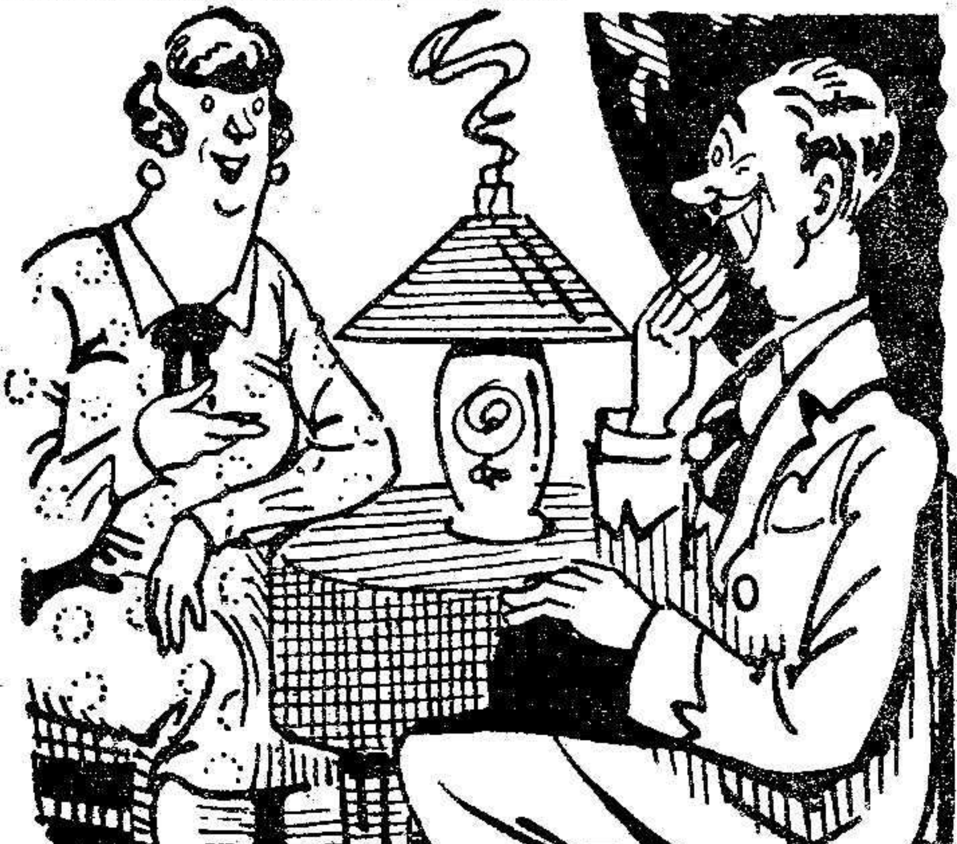
CONSULTA MEDICA —Padece usted, dolores de cabeza, ataques biliosos... ¿qué edad tiene usted? —Veintiocho años, doctor. —Bueno, pondremos, falta de memoria...

Brillante función religiosa en la Iglesia del Sagrado Corazón A las ocho de la mañana se celebró en la iglesia del Sagrado Corazón una misa de comunión general, asistiendo para comulgar, numerosísimos devotos.