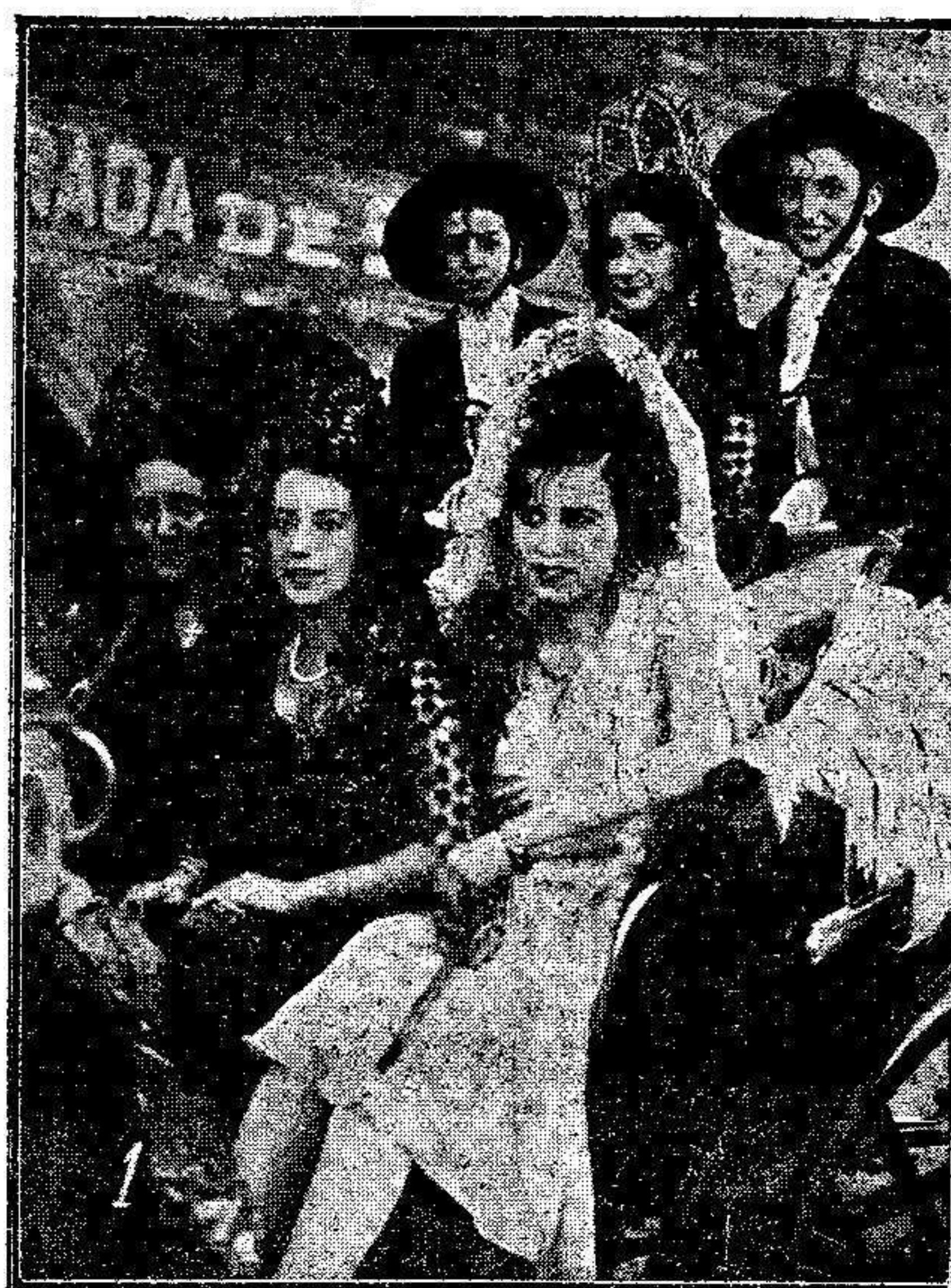
LA CORRIDA A BENEFICIO DE LA CRUZ ROJA Las bellas señoritas de Pozas, Herranz, Pineda, Pavón y Fortea, que presidieron la corrida, al dirigirse a la plaza.

le pasearía enjaulado de pueblo en pueblo y se le motejaría de loco inoportuno hablando al pueblo de libertad en lugar de acomodarse gustosamente en un rincón del presupuesto y cobrar y vivir?