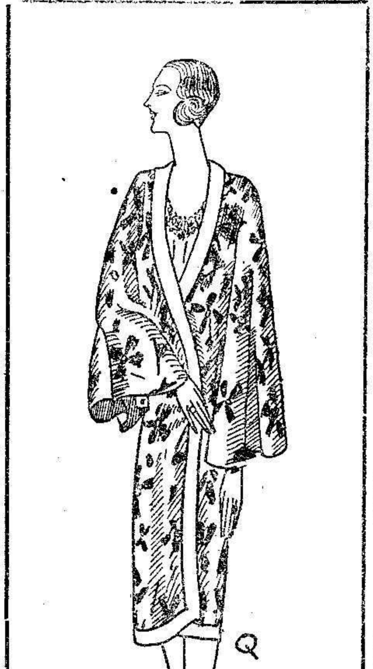
Elegantísimo kimono de crepón estampado, el fondo es color crema y las flores azul marino, las amplias mangas su forma dan a dicho kimono una nota muy elegante, lleva como único adorno una vuelta de crepón liso del mismo tono del fondo

Los bolsos de ante negro, están muy en boga con sus boquillas en metal dorado, muy brillantes. Para sport, los bolsos de lana hacen juego con las charpes, que son largas y estrechas, terminando de cada lado en punta trian-