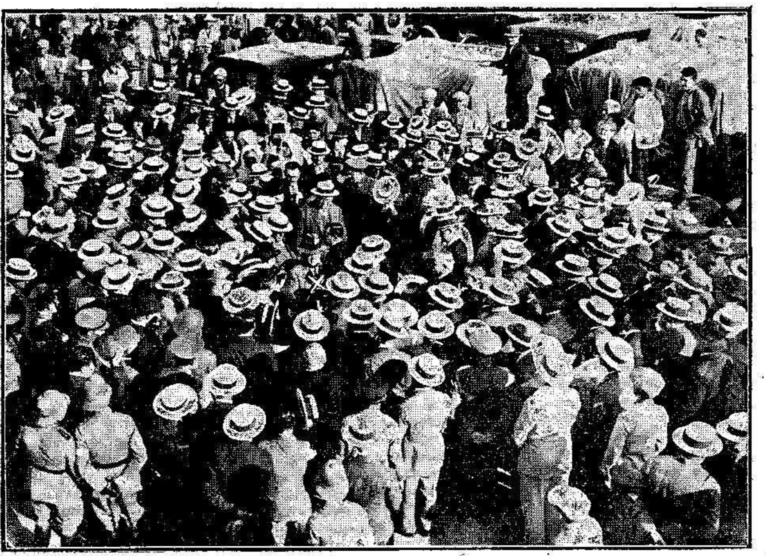
El regreso del presidente de la Junta Municipal. Momentos después de desembarcar del «Vicente la Roca», las comisiones le rodean para felicitarle.