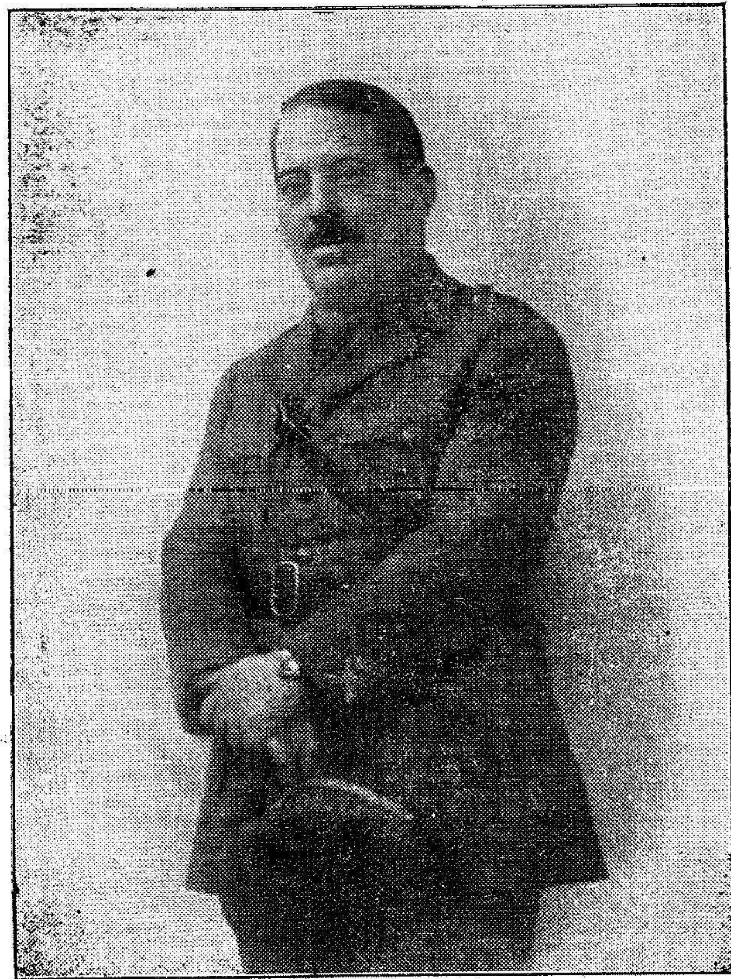
El Excmo. Sr. Jefe Superior de las fuerzas militares D. José Sanjurjo

Artículo 17.—Quedan derogadas cuantas disposiciones se opongan a los preceptos de este Real decreto.