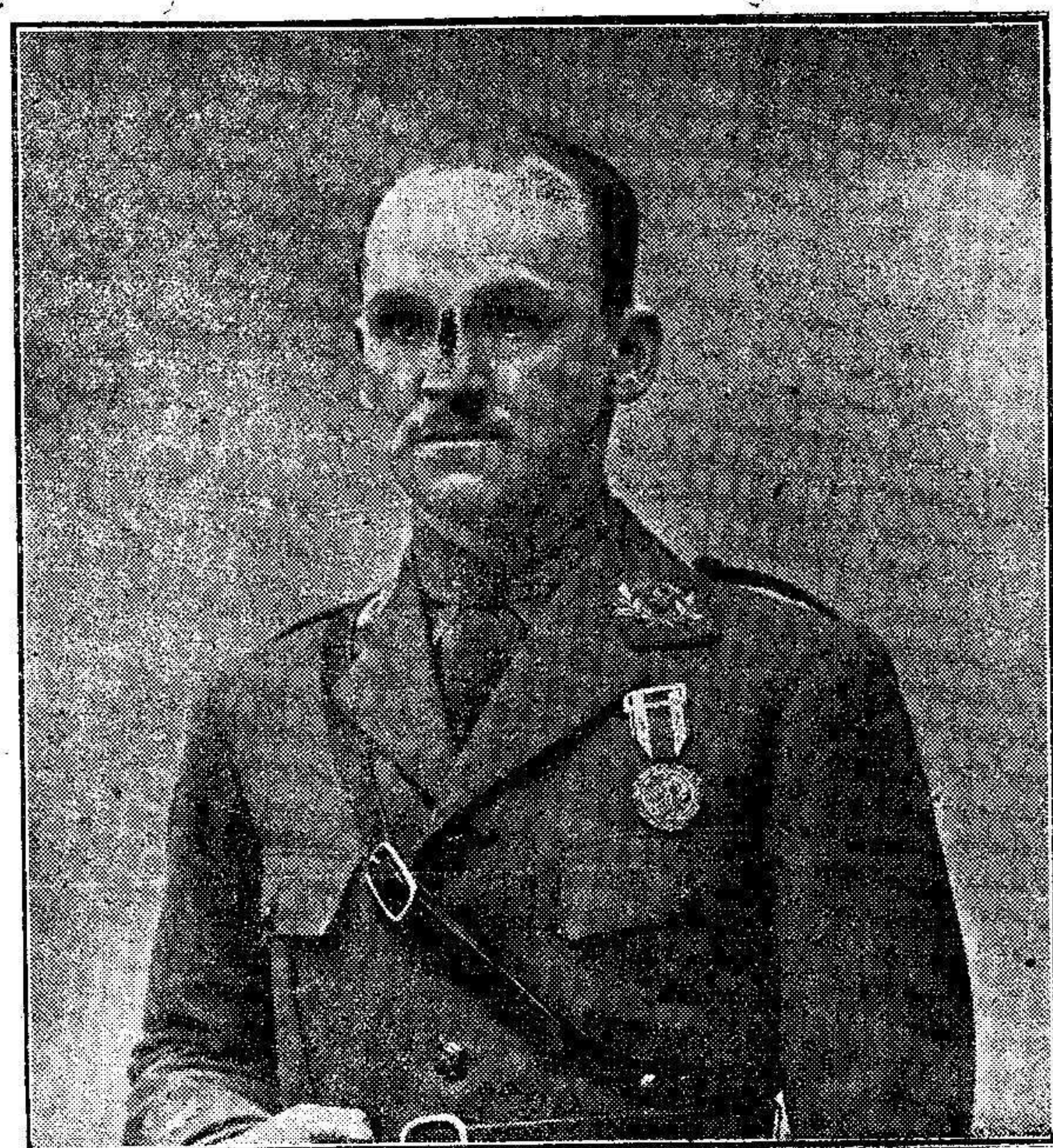
El Excmo. Sr. D. Manuel Goded

Cuantos siguieron sus primeros pasos en Larache, formaron de él un juicio que su actuación posterior ha ratificado plenamente. Allí, como Teniente Coronel; aquí, al frente de las Intervenciones Militares, y después a las órdenes del General Sanjurjo, ha demostrado ser un completo jefe de Estado Mayor.