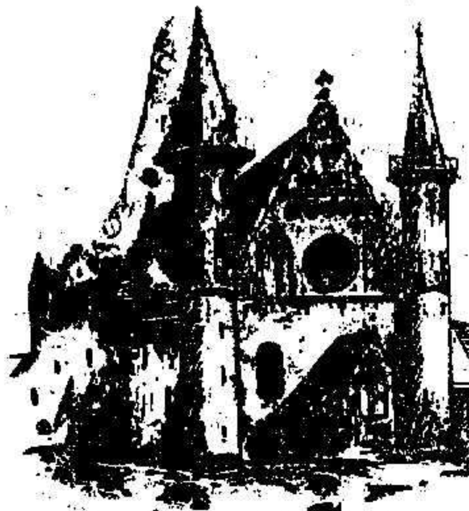
Castillo de Rittersaal donde se celebra el Congreso

La reciente guerra ruso-japonesa, hizo que los trabajos tendentes a las conclusiones votadas en aquel Congreso se vieran paralizados, pero el comité de ejecución, compuesto de un representante de cada gobierno, que en aquel se nombró, continuó sus funciones.