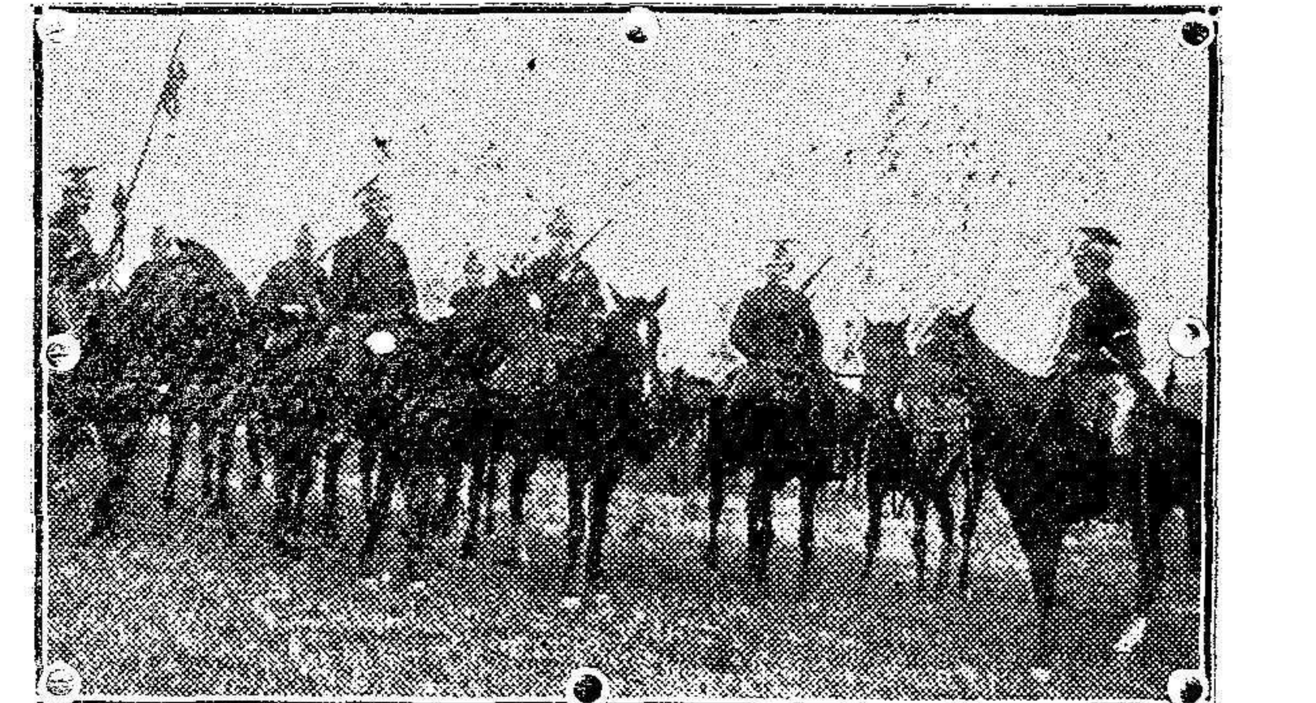
Lanceros belgas reconociendo los alrededores de Amberes

Este periódico publica en su artículo de fondo un importante trabajo, en el que se manifiesta, que si la guerra dura