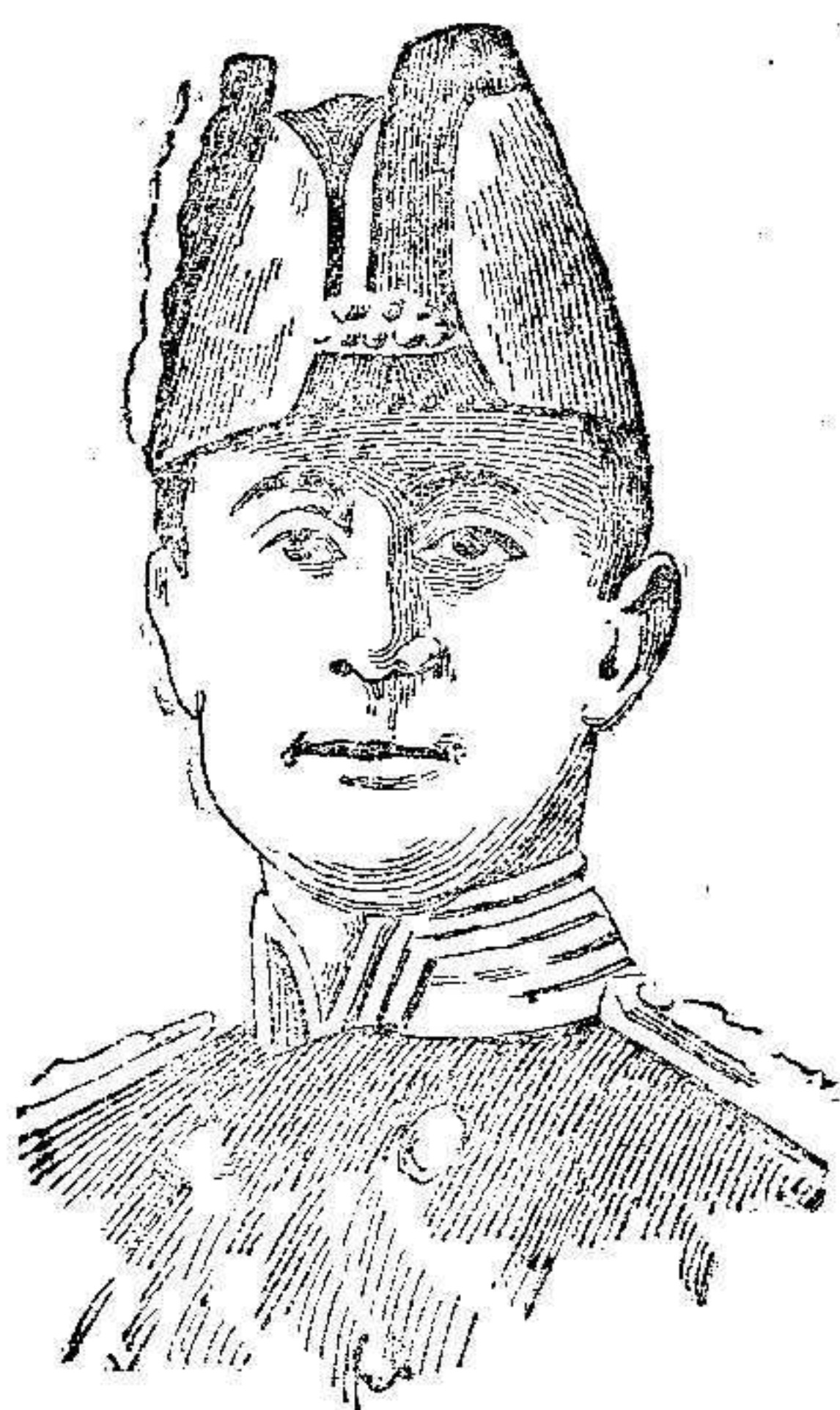
Almirante inglés sir John Jellicoe, que manda la escuadra inglesa que lucha contra Alemania y Austria.

El último «Zeppelin» que voló sobre la ciudad de Amberes, arrojó siete bombas, que causaron daños en consideración en varios sitios. Resultaron doce personas heridas, de ellas cuatro mujeres. Las fuerzas belgas dispararon contra el dirigible, pero éste inmediatamente después de arrojar los explosivos, se elevó marchando hacia Bruselas. Las maniobras envolventes del enemigo han sido hasta ahora conjuradas. En la Lorena y en los Vosgos sigue todo igual. Resistencia heroica de Mauberge. La marcha de los alemanes hacia el Sudeste. Paris se fortifica Burdeos.—El ministro de la Guerra,