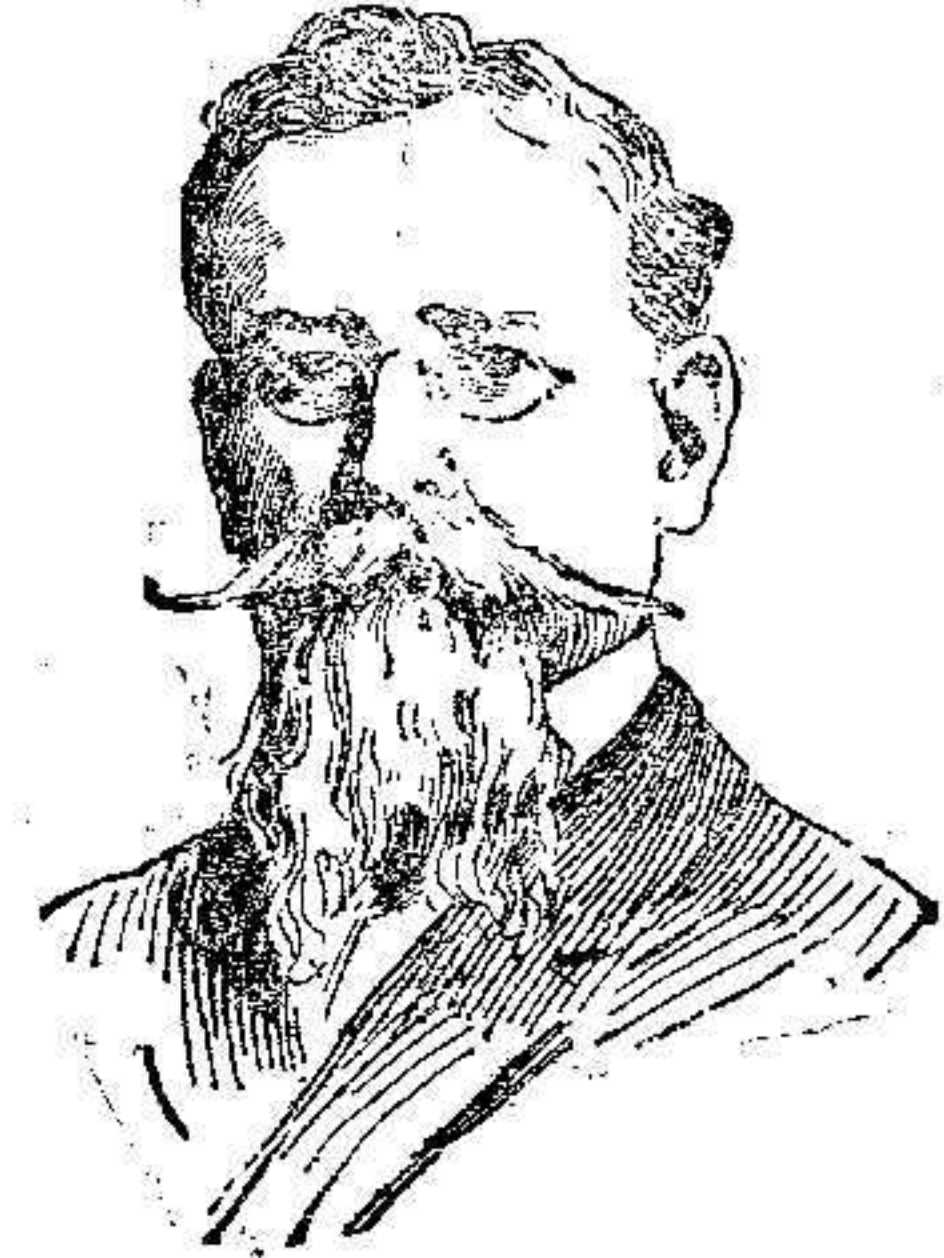
General Carranza que se ha unido al Presidente Huerta, contra los Estados Unidos.