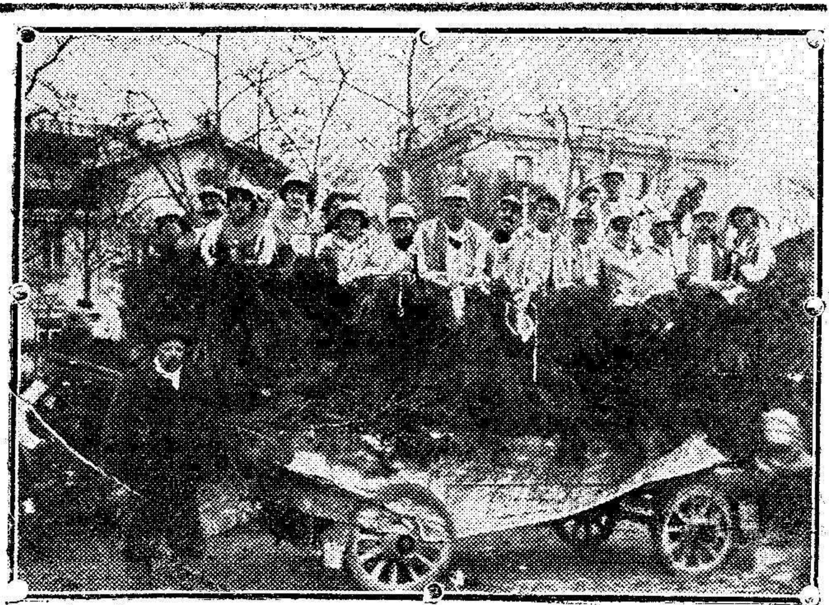
EL CARNAVAL EN MADRID.—Carroza "Jokey Club."

Hoy á las 9 de la mañana seguirá la clasificación y reconocimiento que es posible termine del sábado al domingo.