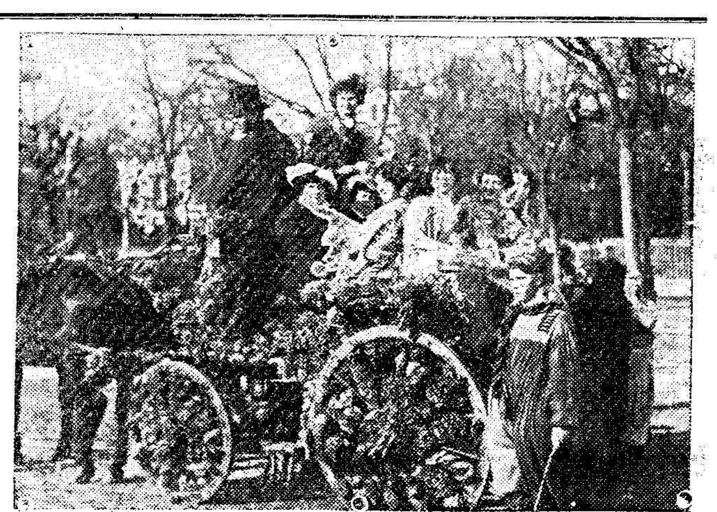
EL CARNAVAL EN VALENCIA.—Artística carroza que ha llamado extraordinariamente la atención.