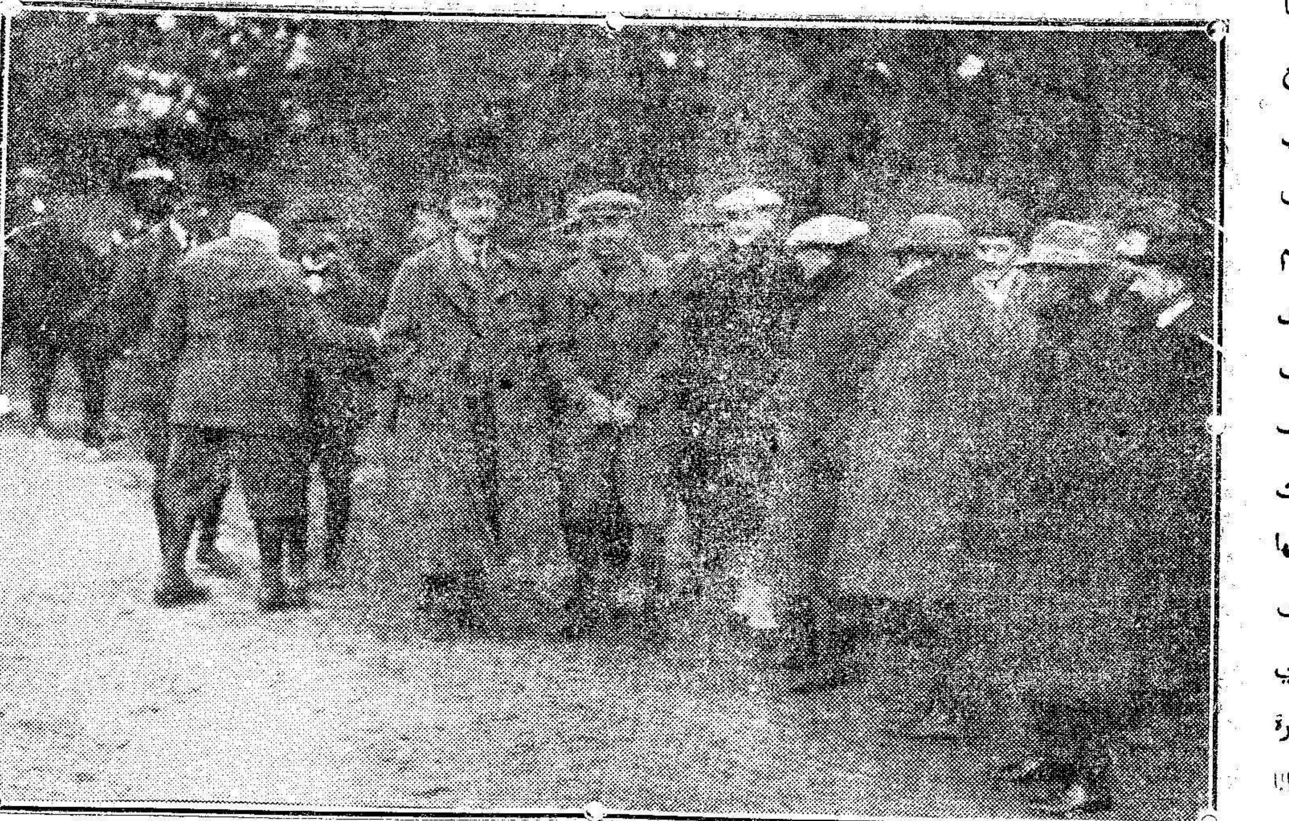
Su Majestad D. Alfonso y los demás cazadores antes de comenzar el primer cazo