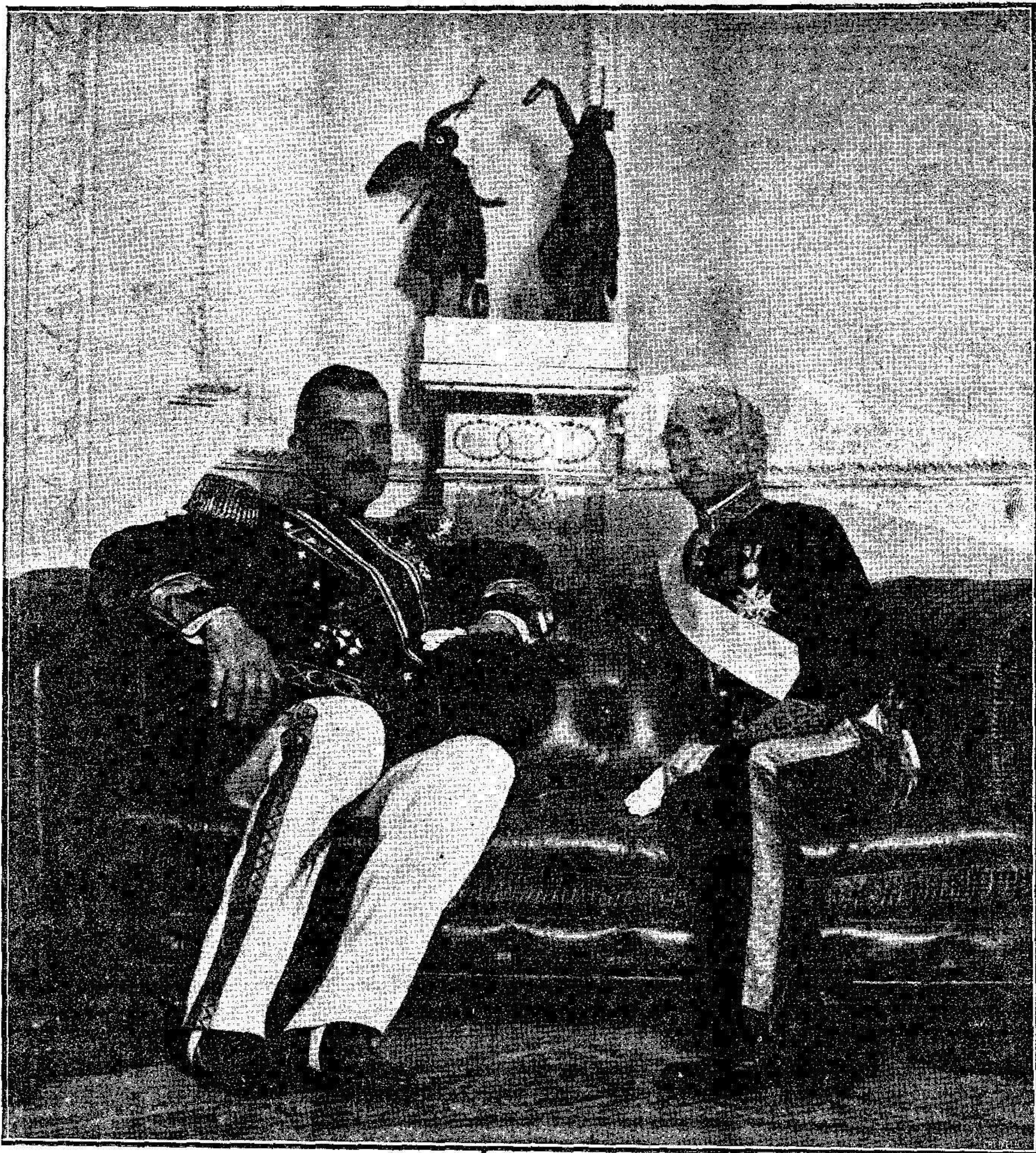
El nuevo embajador de Austria-Hungría, príncipe de Fürstemberg y el Sr. Dato.

El recorrido de 42 kilómetros que tiene esta marcha, la efectuaron las compañías citadas llevando la tropa todo su equipo, equipaje e impedimenta. En las inmediaciones de Sidi Messand, descendió dos horas la columna, para comer el primer rancho, en caliente. A las cinco de la tarde entraban en su cuartel, habiendo salido del campamento de Izhafen a las 7:30 de la mañana. En la marcha que referimos, no hubo afortunadamente que lamentar ningún accidente, no quedando tampoco soldado alguno rezagado.