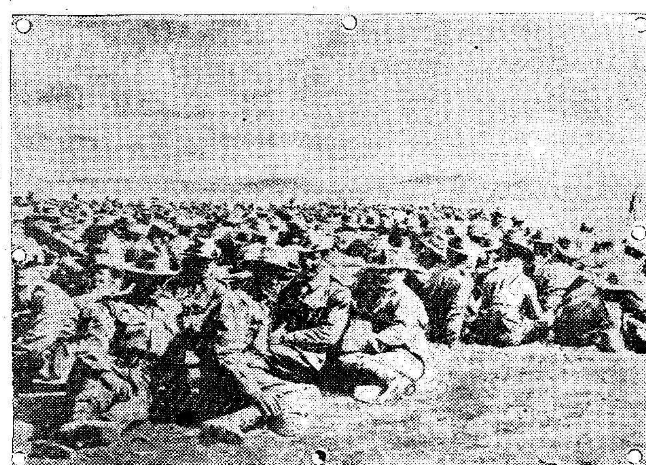
Tropas australianas al servicio de Inglaterra.