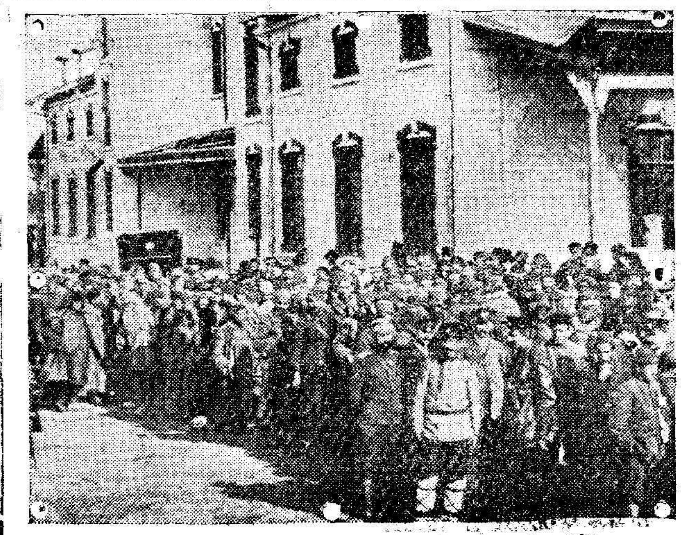
Grupo de reservistas búlgaros para ser incorporados á filas.

Sabiendo es que conforme á las instrucciones del Gobierno, el Comandante en jefe de las tropas de ocupación hizo requisar toda la cosecha de la zona francesa y prohibió su salida en el mes de Marzo, cualquiera que fuese su destino, á fin de que no faltasen cereales para el servicio de Intendencia, continuando este estado de cosas hasta el aludido decreto de Octubre, que restableció los derechos de importación.