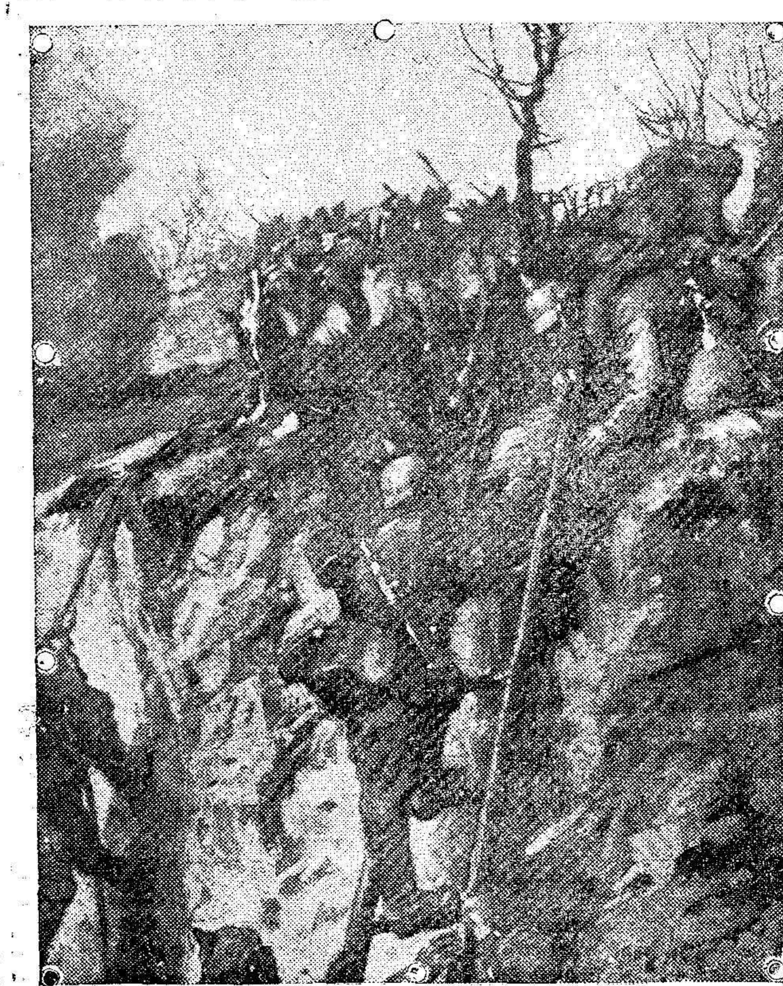
Asalto con escaleras en la cantera cerca de Vregny, durante la batalla en las cercanías de Soissons

Reconocimiento de artículos de piono, Taxdir cuarto Capitán.