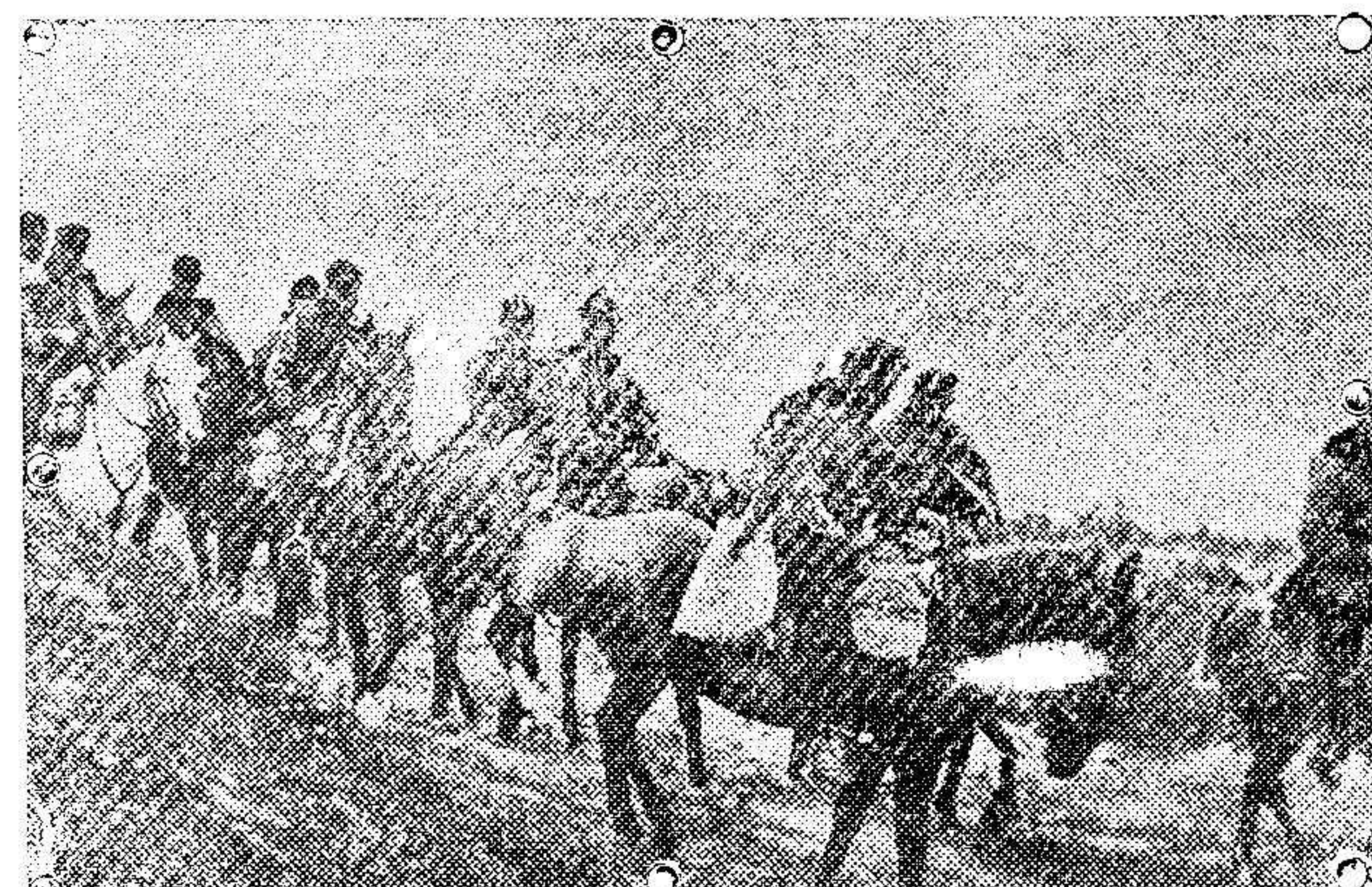
Ulanos austrohúngaros patrullando a orillas del Vistula

La velada en el Torreón de las Cabras tuvo encantos y atractivos. Fué una verbena clásica, con los farolillos venedecianos, mástiles, gallardetes y el indispensable arco, por cierto muy artístico, con inscripción que decía «Viva la heroica ciudad de Melilla! La