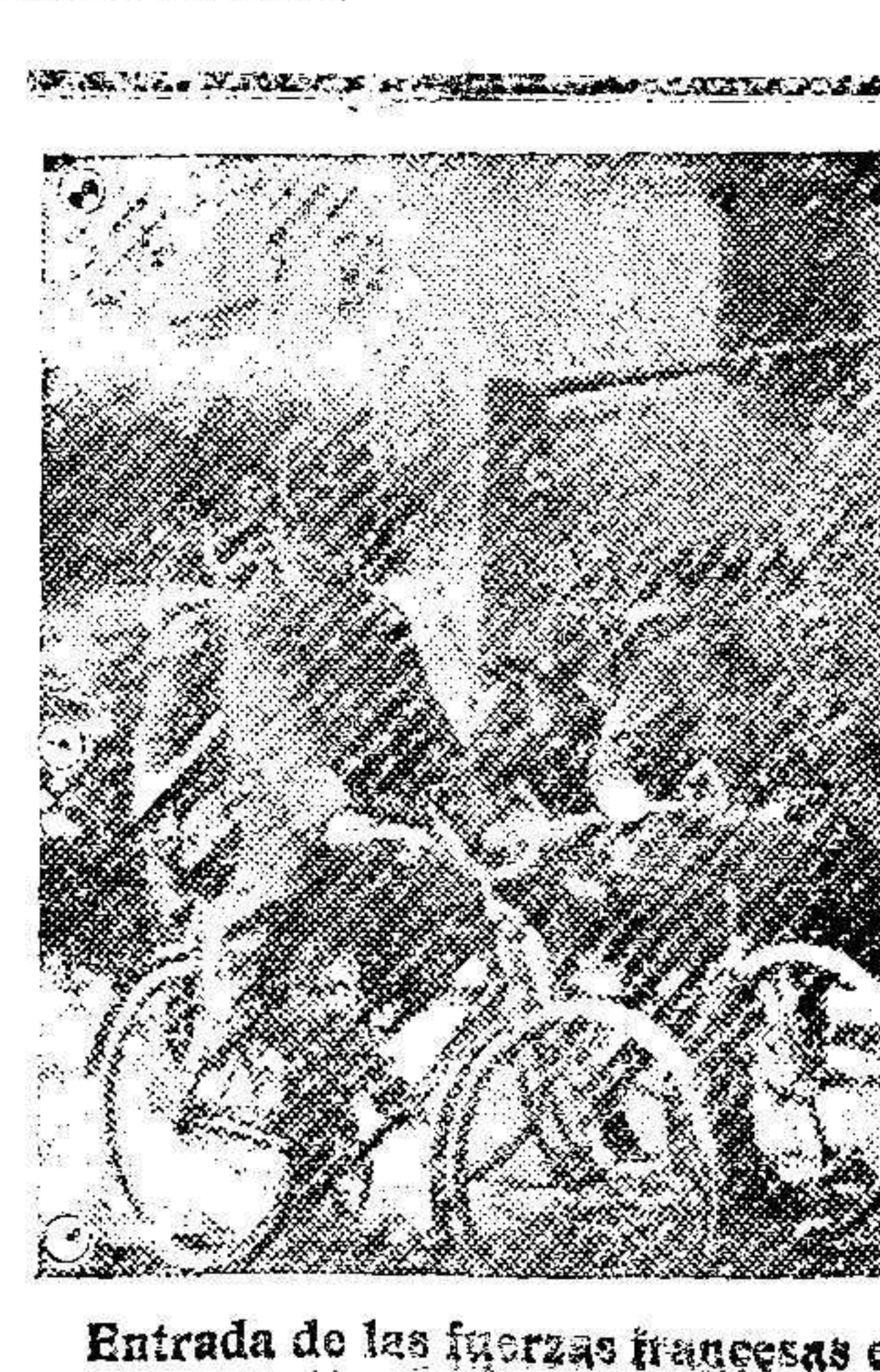
Entrada de las fuerzas francesas en la ciudad de Thann, en Alsacia